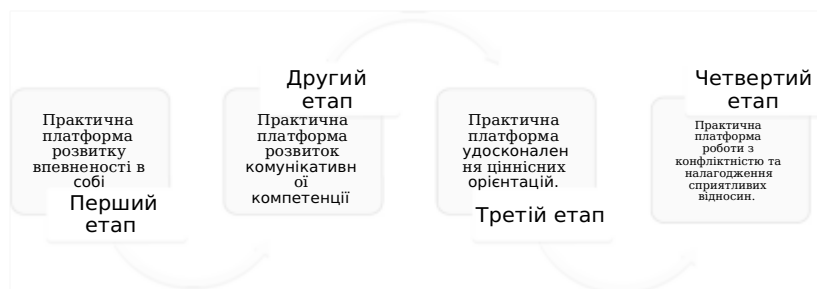
Рис. 4. Структура технології розвитку комунікативної компетентності педагогів.

компетентності педагогів, що мають формат воркшопів за чотирма практичними платформами (Рис.4).