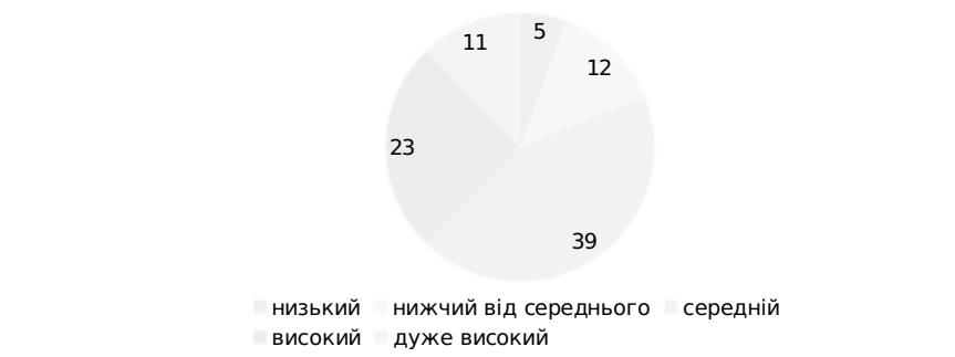
Рис. 2. Показники комунікативних здібностей педагогів

Визначено, що педагогічним працівникам притаманний переважно середній та високий рівень комунікативних здібностей. Відсоткові показники можемо переглянути на рис. 2.