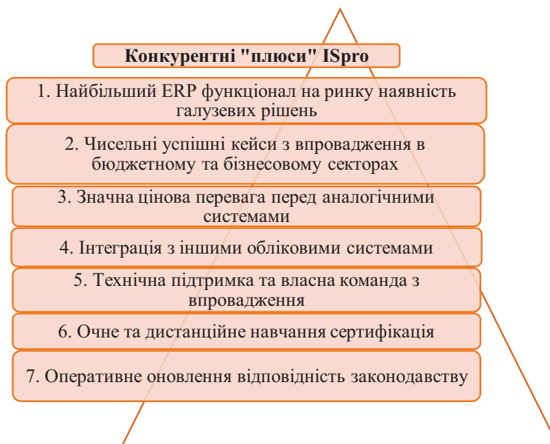
Рис. 2 Конкурентні «плюси» ISpro як ERP-системи

Отже, розглянувши переваги, завдання та можливості модульної системи обробки інформації, можна зробити висновок, що «ІС-ПРО» доцільно використовувати на підприємствах. Так як даний програмний комплекс створений саме українськими спеціалістами, забезпечує автоматизацію основних бізнес-процесів, в ньому повністю враховано законодавчі та економічні реалії держави та створений для управління підприємствами різного профілю. Також адаптація системи до підприємств різного профілю виконується за рахунок підбору компонентів програми, що дає змогу обирати те, що потрібніше.