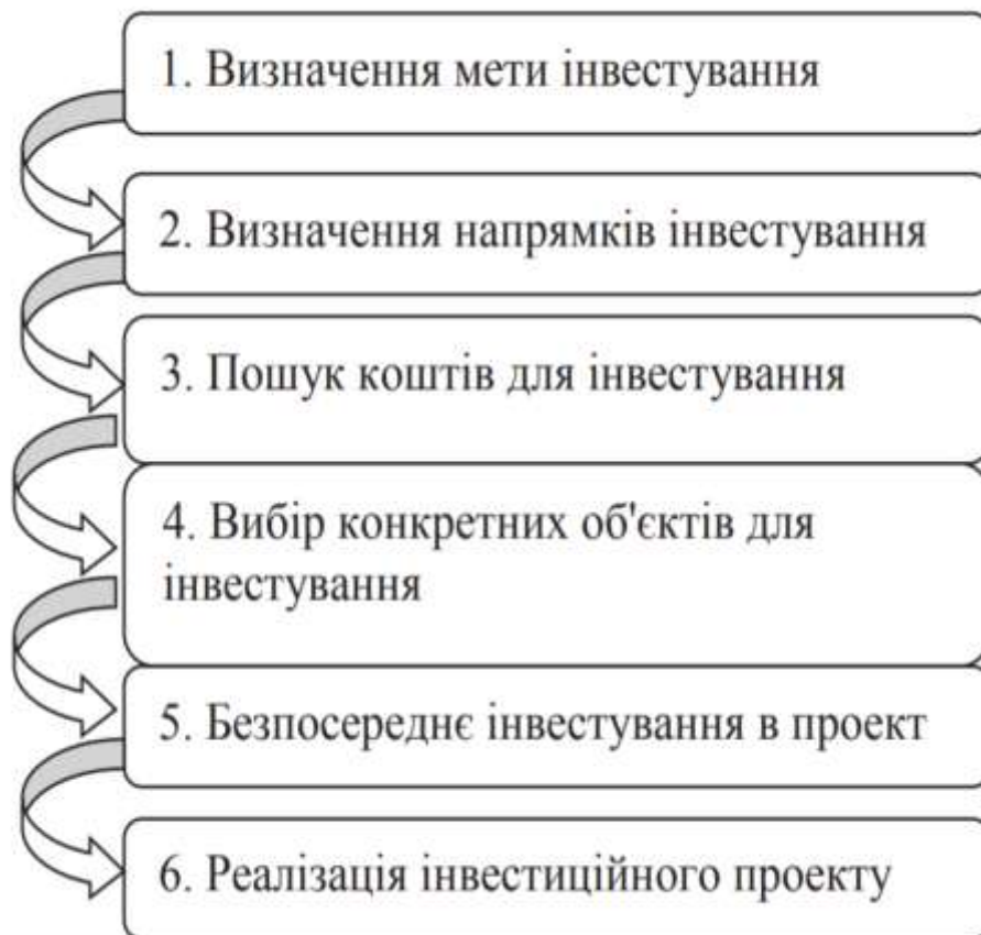
Рис. 1. Етапи інвестиційного процесу [1]

В загальному вигляді інвестиційний процес можемо розглядати як сукупність етапів руху інвестицій в різних формах та на різних рівнях, які виражають відносини, які виникають між учасниками інвестиційного процесу при формуванні та використанні інвестиційних ресурсів (рис. 1).