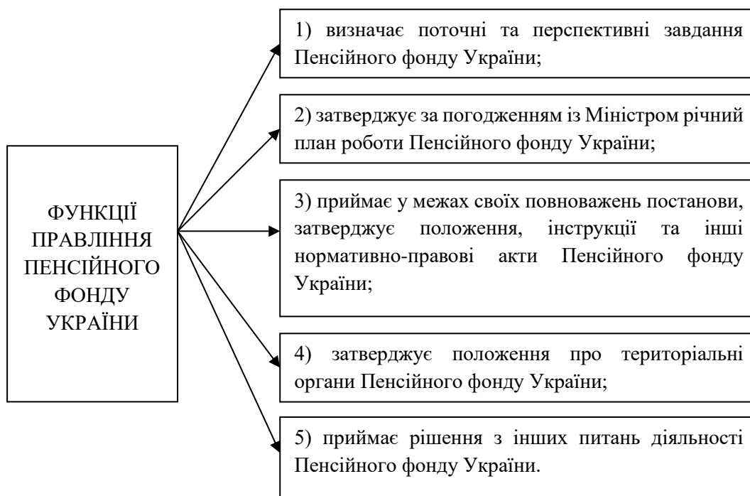
Рис. 3. Функції правління Пенсійного фонду України

Керівництво діяльністю Пенсійного фонду України здійснює правління Пенсійного фонду України, чисельність і персональний склад якого затверджуються Кабінетом Міністрів України. Пенсійний фонд України є самостійною, неприбутковою установою яка провадить свою діяльність на підставі затвердженого його правлінням статуту. Управління Пенсійним фондом України відбувається на паритетній основі між державою, представниками застрахованих осіб та роботодавців через відповідні правління і виконавчі дирекції, до складу яких входять представники від цих сторін. Нагляд за діяльністю Пенсійного фонду України здійснює відповідна Наглядова рада. На рис. 3 представлено функції правління Пенсійного фонду України.