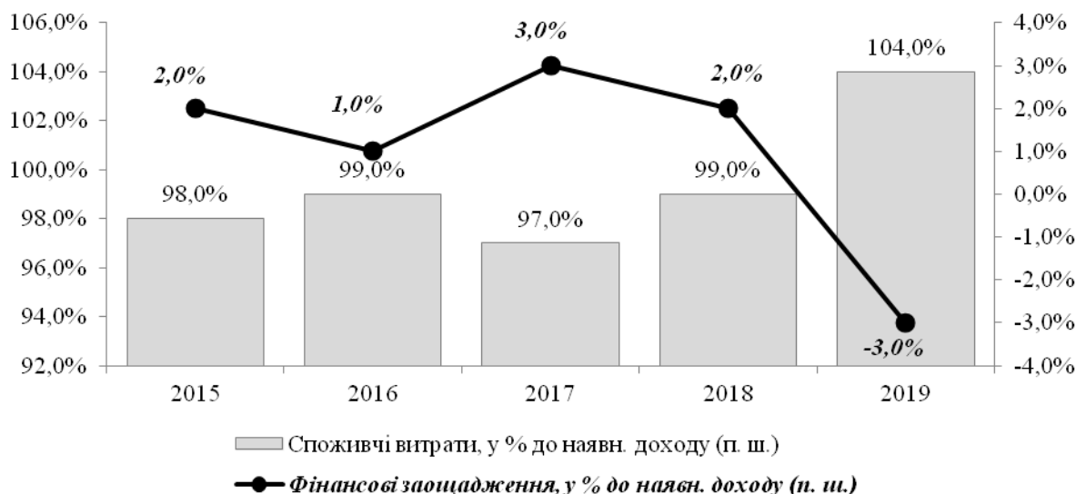
Рис. 2. Рівень споживчих витрат і фінансових заощаджень домогосподарств у 2015-2019 рр.

У 2019 р. зафіксоване стрімке зменшення фінансових заощаджень домогосподарств, що обумовлено, на нашу думку, значним зростанням споживчих витрат, а у 2019 р. вони перевищували доходи, що унеможливило здійснення домогосподарствами фінансових заощаджень (рис. 2).