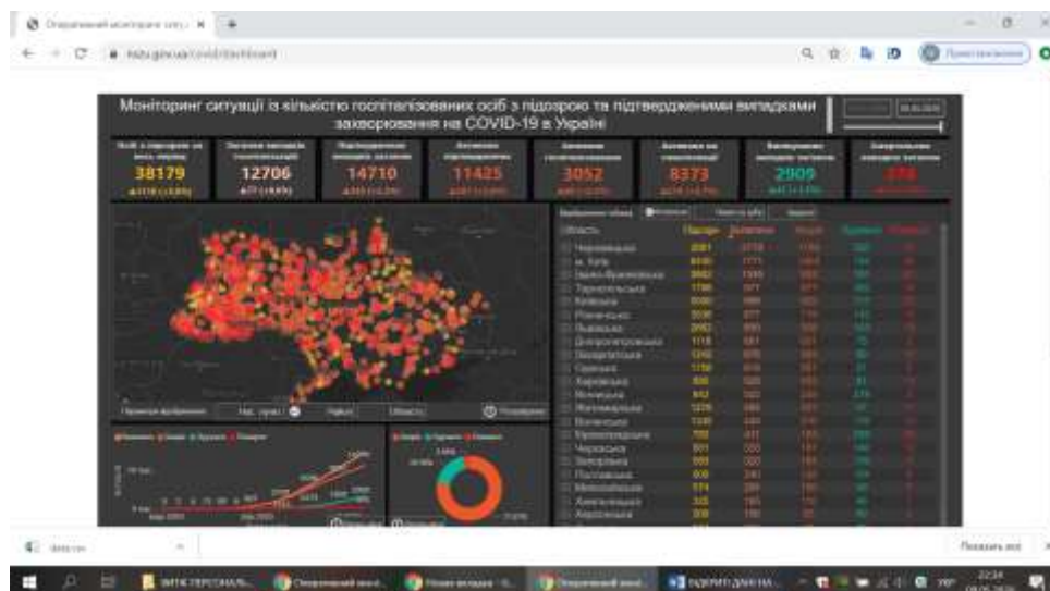
Рис.2 Моніторинг ситуації із кількістю госпіталізованих осіб з підозрою та підтвердженими випадками захворювання на COVID-19 [3]

Можна зробити висновок, що відкриті дані є корисними для суспільства, допомагають приймати управлінські рішення, впливають на політику, економіку, безпеку та мають широке застосування у різних сферах. Відкриті дані допомагають швидше зреагувати на соціальні та економічні наслідки.