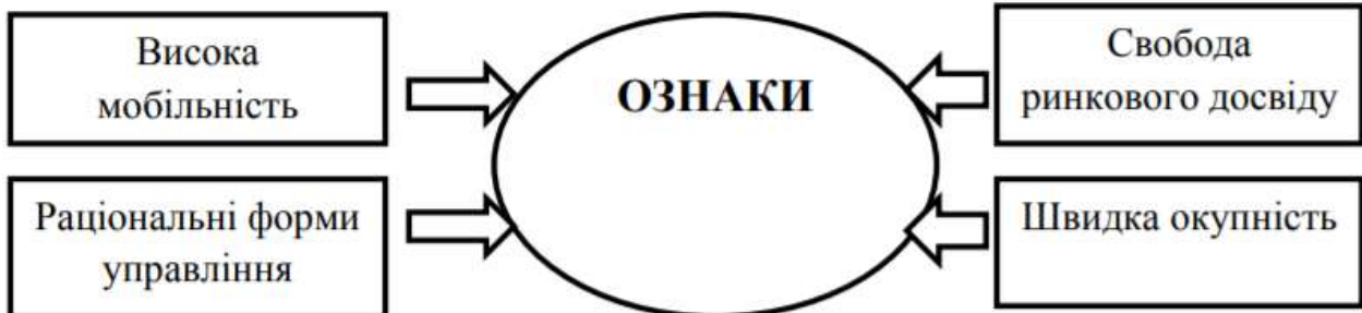
Рис. 1. Ознаки підприємств малого та середнього бізнесу [2]

Сучасний стан розвитку підприємств малого та середнього бізнесу істотно пов'язаний з дією низки об'єктивних чинників. Існує низка ознак за якими виділяють підприємства малого та середнього бізнесу, які для різних країн є варіативними, однак, в Україні основними можна вважати показники наведені на рис.1.