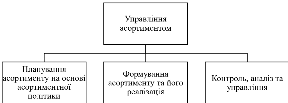
Рис. 2. Система управління товарним асортиментом

Раціональність настає з виявлення запитів покупців до товарів конкретної асортиментної політики. З цією метою застосовуються такі способи, як соціологічний, тобто проведення опитування або спостереження. Крім того, підприємства, які застосовують стратегію інтенсивного маркетингу, формують попит з допомогою реклами, презентацій та виставок-продажів.