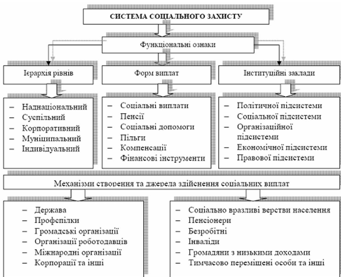
Рис. 1.1. Складові системи соціального захисту населення

За функціональною ознакою та механізмами формування джерел здійснення соціальних виплат, соціальний захист є складною системою, яка передбачає реалізацію функцій соціального сприяння і захисту на різних рівнях та за участю різних суспільних інституцій (рис. 1.1).