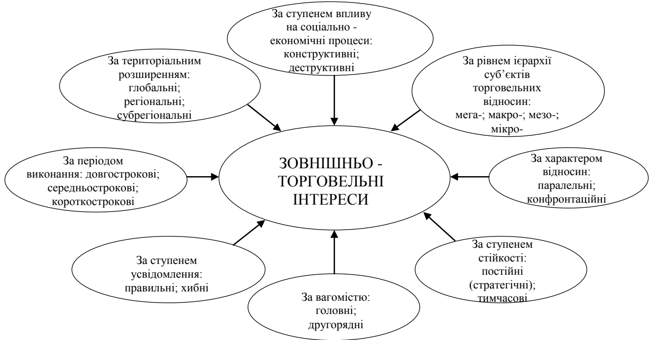
Рис. 1. Класифікація зовнішньоторговельних інтересів

Обґрунтовано, що зовнішньоторговельні інтереси охоплюють не лише сферу міжнародної торгівлі, а й інші структурні ланки національної та глобальної економік, тому питання забезпечення зовнішньоторговельних інтересів країн є юрисдикцією як наднаціональних, так і міжнародних норм регулювання.