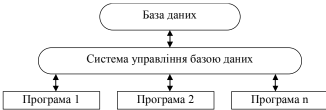
Рис. 2. Складові інформаційної системи підприємства та їх взаємозв'язок

Вказані складові взаємодіють між собою наступним чином (рис. 2).