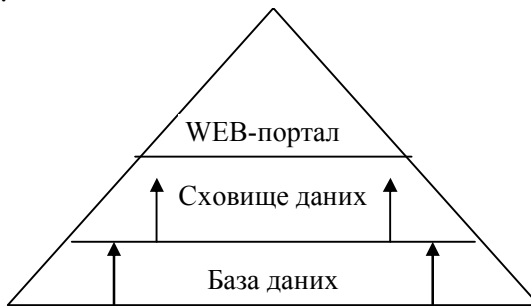
Рис. 1. Структура сучасної інформаційно-аналітичної системи підприємства [1, с. 40]

Інформаційні системи підприємств сьогодні – це не просто операційні системи, що фіксують поточні транзакції, це складні аналітичні системи і навіть системи підтримки прийняття рішень, що формують кілька можливих варіантів управлінських рішень, виходять у кіберпростір для взаємодії з покупцями, постачальниками, конкурентами (рис. 1). Сьогодні інформаційні технології використовуються для вивчення уподобань, звичок і потреб користувачів, тенденцій розвитку ринків та стратегій конкурентів.