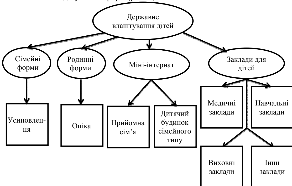
Рис. 1. Запропоновані форми влаштування дітей

Дослідженням встановлено, що ССВД представляє собою державне влаштування дитини у сім'ї громадян або інтернатні заклади. На базі комплексного аналізу форм державного влаштування ДС і ДПБП сформовано нове бачення поділу таких форм (рис. 1).