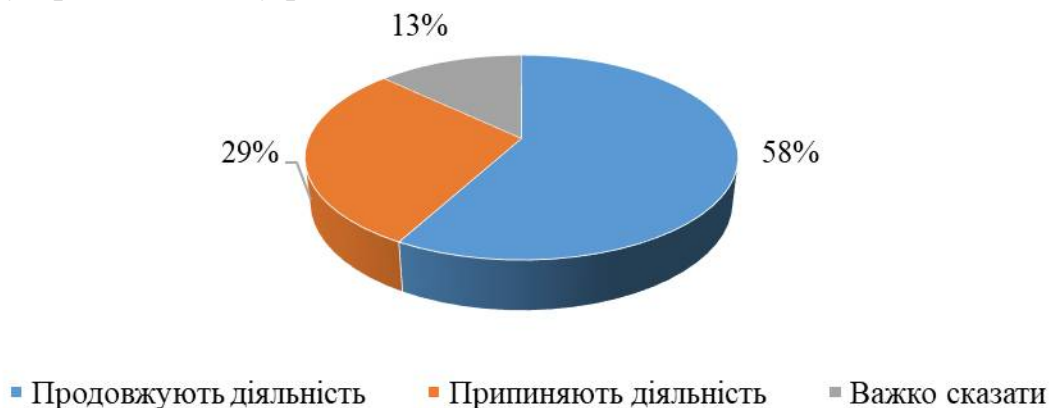
Рис. 1. Діяльність підприємств України в умовах карантину (2020 р).

слабкий імунітет; 33% вважають, що краще розглядати індивідуальний підхід до конкретної території, а лише 1% респондентів очікують на повне припинення карантину. Більш наглядно діяльність підприємств в умовах карантину представлено у рис. 1.