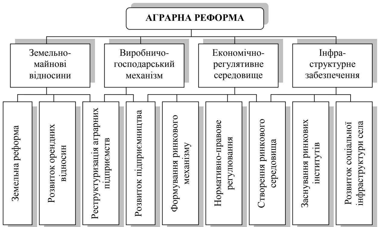
Рис. 1. Основні складові аграрної реформи в Україні

Виявлено, що національний аграрний сектор характеризується повільними темпами розвитку інституційного забезпечення відносин власності й підприємництва. В результаті основною проблемою на цьому етапі визнано потребу в зміцненні ринкових виявів у господарсько-виробничому механізмі аграрних формувань.