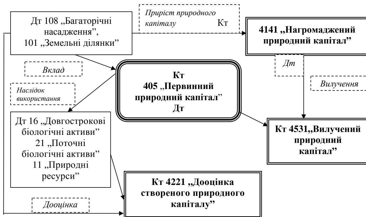
Рис. 3. Схема обліку природного капіталу

Для врахування вирубки природного капіталу, що його вклала держава, запропоновано аналітичний рахунок до субрахунку 453 „Інший вилучений капітал”, а саме 4531 „Вилучення природного капіталу”. Порядок обліку на запропонованих рахунках схематично ілюструє рис. 3.