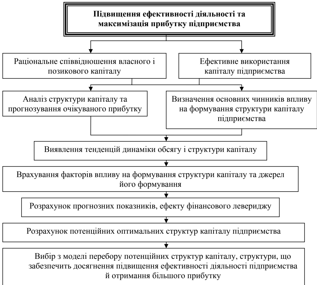
Рис. 4. Алгоритм оптимізації структури капіталу підприємств лісового господарства

Віднесення природного капіталу до складу власного визначає необхідність аналізу зростання та нагромадження природного капіталу з метою визначення приросту його вартості, ефекту від використання, а також для розрахунку і контролю над витратами, прогнозування можливих прибутків, що дасть змогу підприємству сформуванню оптимальну стратегію управління природним капіталом й підприємством загалом.