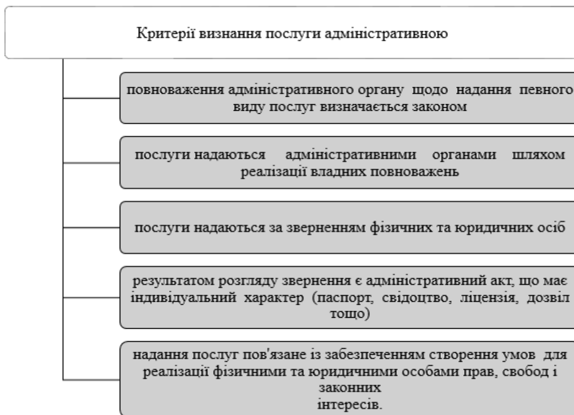
Рис. 2. Перелік критеріїв визнання послуги адміністративною [3]

Безумовно, державна політика адміністративних послуг наразі формується у контексті реформи державного управління. Ця реформа спрямована на побудову сучасної, цифрової, сервіс-орієнтованої держави. Реформа передбачає формування ефективної системи державного управління, здатної розробляти та реалізовувати інтегровану державну політику, орієнтовану на потреби людей, сталий соціальний розвиток та гідне подолання як внутрішніх, так і зовнішніх викликів. Таким чином, реформа державного управління покликана змінити підхід до трьох ключових елементів виконавчої влади – структур, процесів і людей за рахунок інструментів. Результати вищезазначеної державної реформи подано на рис. 3.