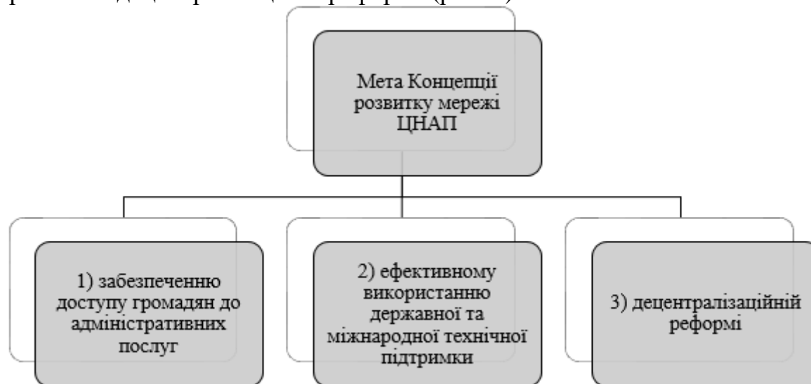
Рис. 1. Складові мети Концепції розвитку мережі ЦНАП [5]

Зарубіжна практика демократичного врядування свідчить, що від ефективності побудови системи адміністративних послуг значною мірою залежить рівень і якість управлінських рішень органів влади, їх здатність своєчасно адаптуватися до змін соціального середовища. Передусім реформи державного управління передбачають цілеспрямовані зміни структур і процесів організацій державного сектору з метою покращення їх функціоналу. Так, у травні 2019 року фахівці робочої групи «Адміністративні послуги» Ради донорів при Мінрегіоні з питань децентралізації підготували концепцію розвитку мережі ЦНАП, головною метою якої є забезпечення доступу громадян до адміністративних послуг, ефективне використання державної і міжнародної підтримки та децентралізаційна реформа (рис. 1).