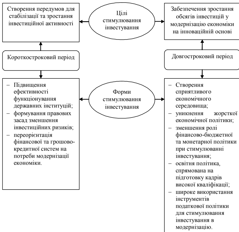
Рис. 3. Цілі та форми стимулювання інвестування в модернізацію на інноваційній основі

Застосування фінансово-бюджетної політики має узгоджуватись із структурною так, щоб не провокувати негативних наслідків як для інвесторів, так і для економіки держави. В тому числі може передбачатись зменшення ролі фінансово-бюджетної та монетарної політики в стимулюванні інвестування. Так, необхідність утримання державного боргу стримуватиме інвестування, однак дозволить здійснити структурні перетворення. Монетарне стимулювання збільшить можливості до інвестування, однак зменшить можливості бюджетної політики, що викличе нестійкість економіки під час циклічного спаду.