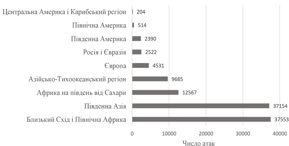
Рис. 3. Розподіл терористичних атак за регіонами світу, 2002-2019 рр.*

Слід відмітити, що цьому сприяли активні збройні конфлікти на Близькому Сході та в Північній Африці у 2018-2019рр. між такими країнами: Єгиптом (субнаціональний збройний конфлікт високої інтенсивності), Іраком (інтернаціоналізована громадянська війна), Ізраїлем (позадержавний збройний конфлікт низької інтенсивності), Сирією (велика інтернаціоналізована громадянська війна), Туреччиною (позадержавний і субнаціональний збройний конфлікт низької інтенсивності) та Єменом (велика інтернаціоналізована громадянська війна) [12]. Про це, свідчить кількість терористичних атак по регіонах світу зображених на рис. 3.