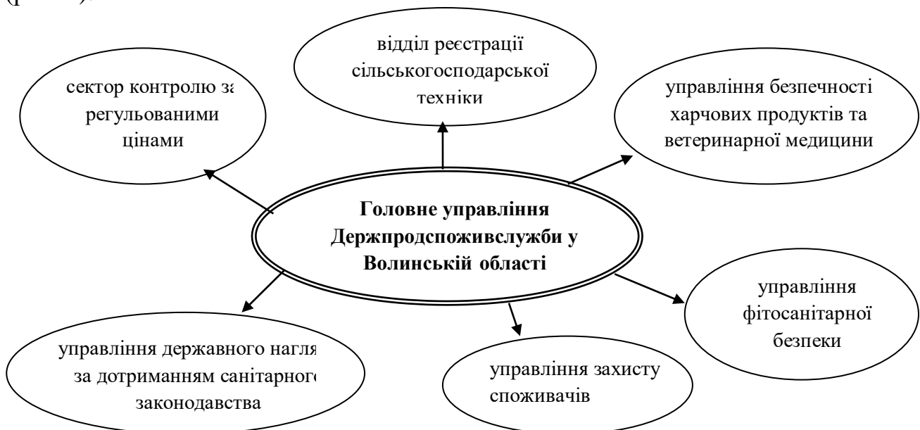
Рис. 2. Структура Головного управління Держпродспоживслужби у Волинській області

Для виконання покладених завдань у складі Головного управління Держпродспоживслужби у Волинській області функціонують управління, відділи та сектори, діяльність котрих забезпечує виконання покладених повноважень (рис. 2).