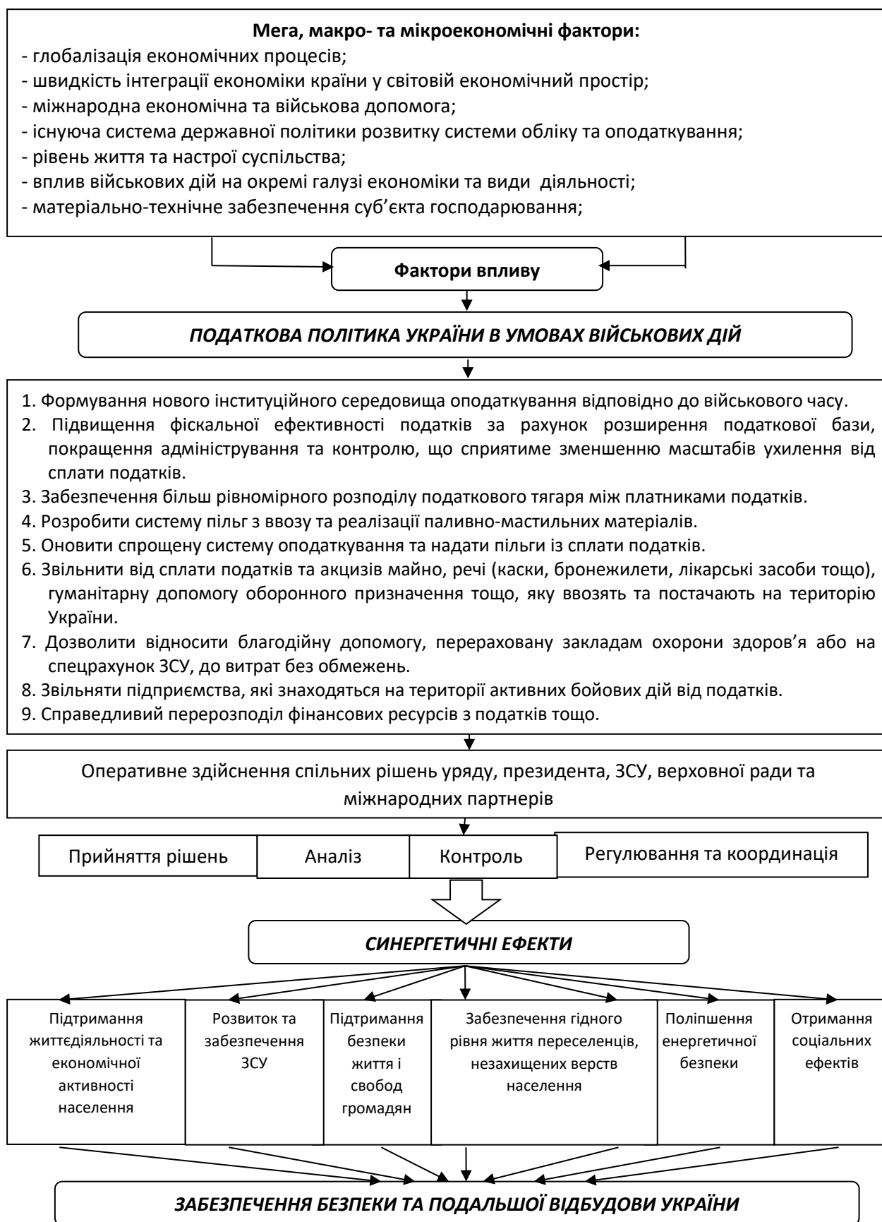
Рис. 3. Вплив податкової політики на забезпечення безпеки та подальшої відбудови України.