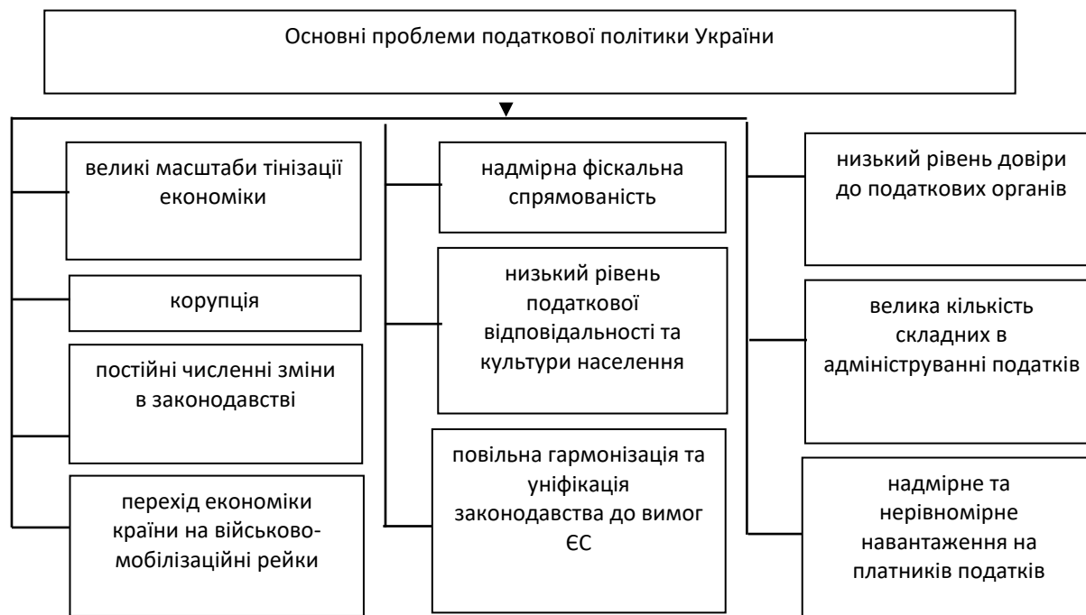
Рис. 2. Основні проблеми податкової політики України

Основні проблеми української податкової політики згруповані на рис. 2.