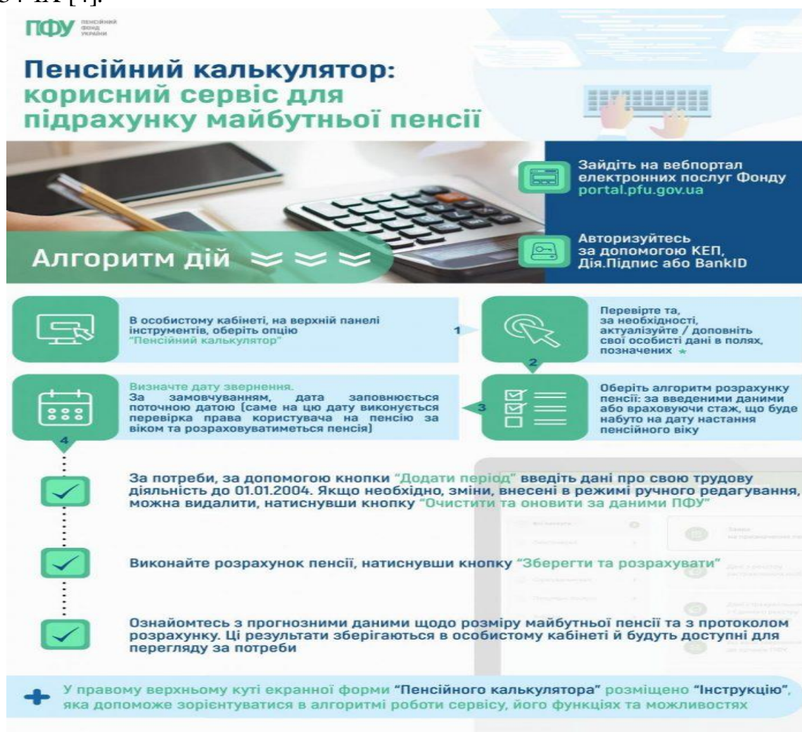
Рис. 1. Алгоритм дії пенсійного калькулятора від ПФУ [3]

загальнообов'язковому державному пенсійному страхуванні» від 04.11.2022 року № 2734-IX [4].