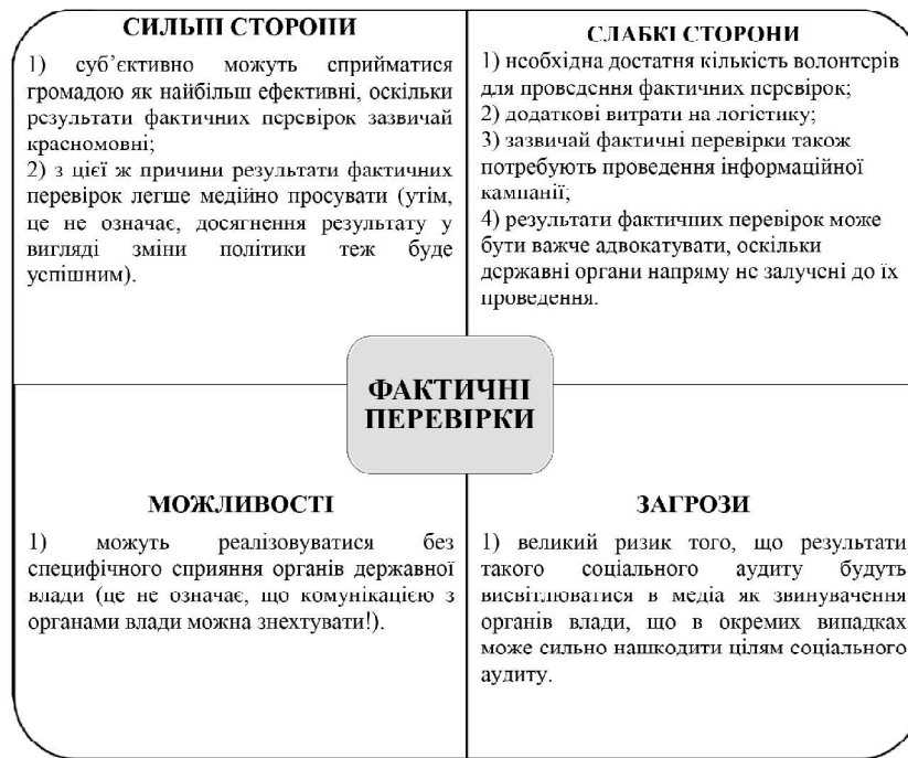
Рис. 1. Swot-аналіз фактичних перевірок