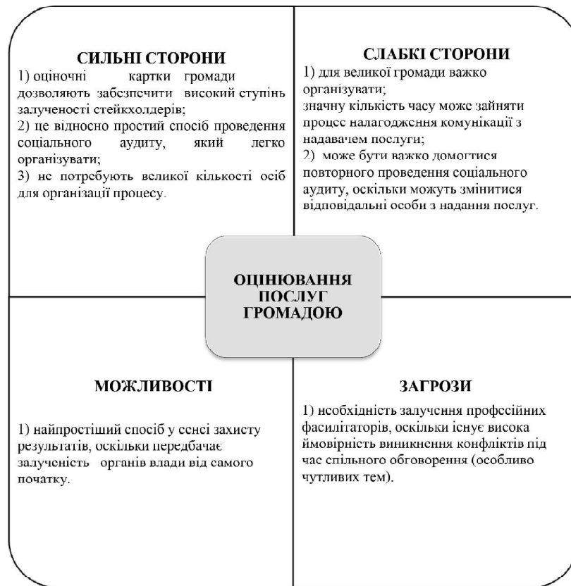
Рис. 2. Swot-аналіз оцінювання послуг громадою