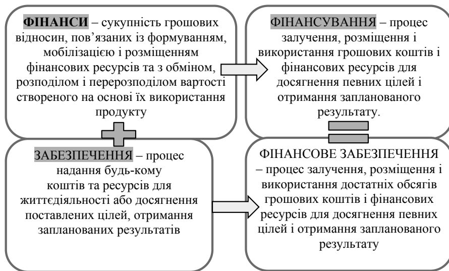
Рис. 1. Схема визначення сутності поняття “фінансове забезпечення”

чення в цілому можна розуміти як синонім, з тією відмінністю, що останнє потребує визначеної суми коштів.