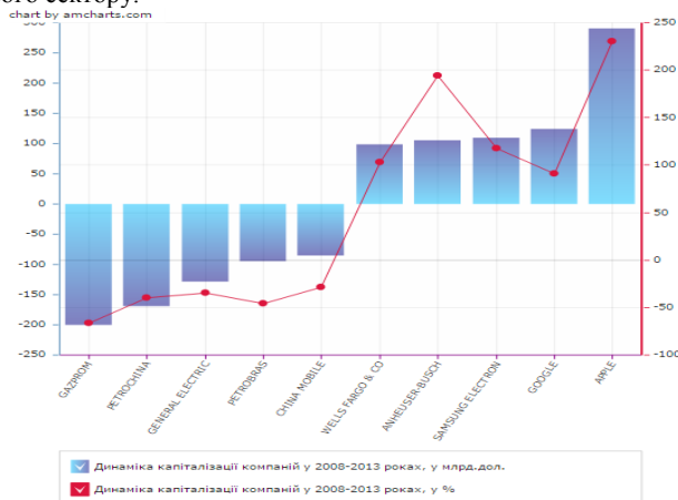
Рис. 4. Динаміка показників капіталізації 5-ти найменш та найбільш успішних компаній світу в 2008-2013 роках

Підводячи підсумки проведеного аналізу, можна зробити висновок про суттєві зміни у структурі сотні найбільш багатших компаній світу, які відбулися з 2008 по 2013 рік. З числа нових компаній, 6 зі США, а 8 належать до фінансового сектору.