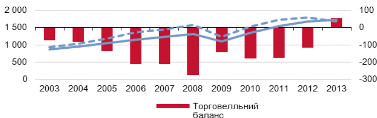
Рис. 1. Показники розвитку зовнішньої торгівлі ЄС-28 за період 2003-2013 років.

Загальні показники розвитку зовнішньої торгівлі ЄС приведені на рис. 1.