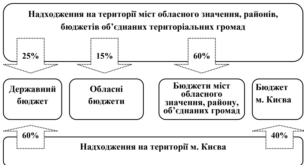
Рис. 1. Нормативи розщеплення податку на доходи фізичних осіб за ланками бюджетної системи*

У 2016 р. також вступили в дію зміни, які стосуються зміцнення дохідної частини місцевих бюджетів. Зокрема, в частині справляння податку на доходи фізичних осіб запроваджено єдину ставку в розмірі 18% для доходів із заробітної плати, замість так