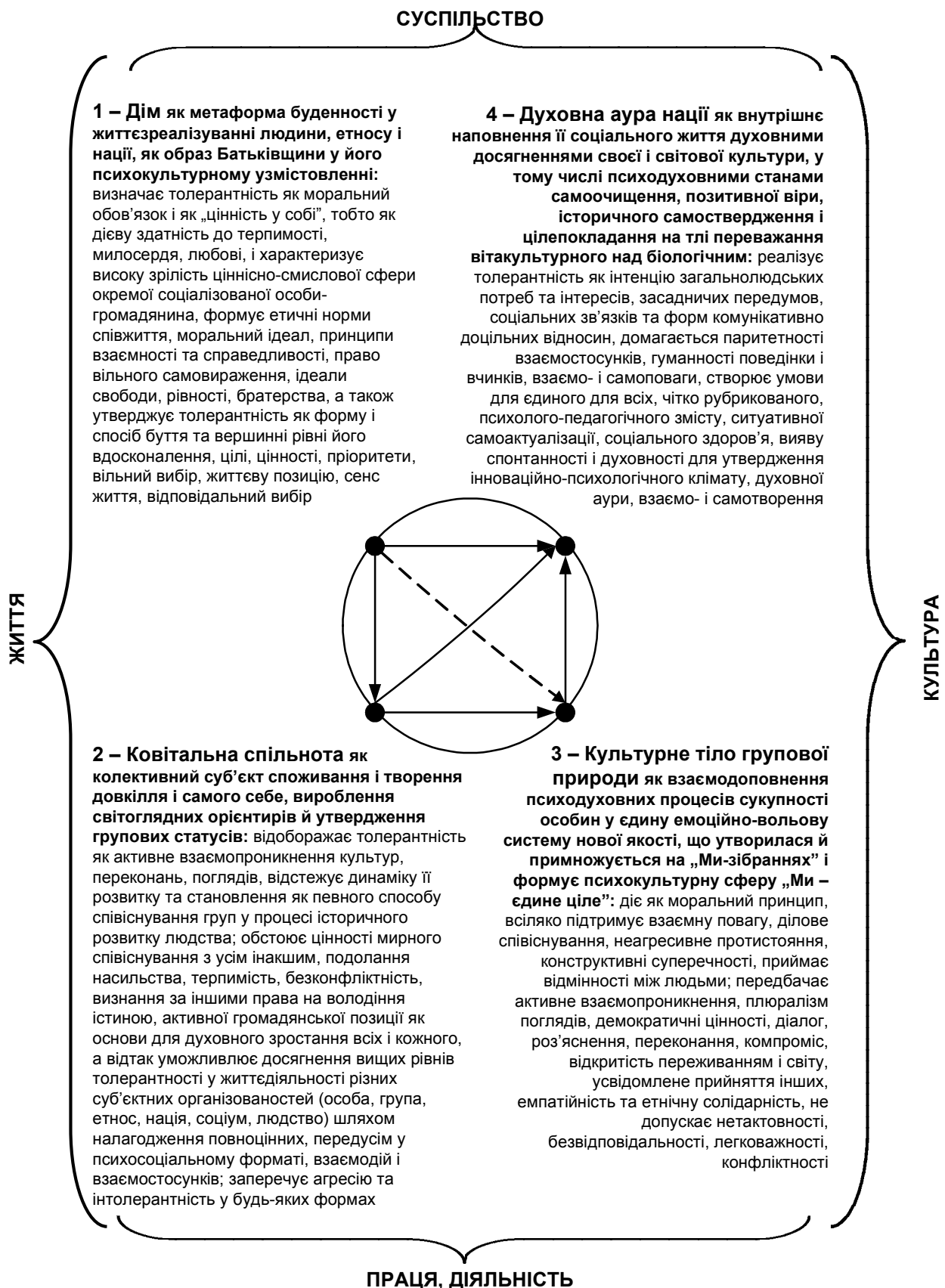
Рис. 3. Чотирисходинковий інтерпретаційний шлях пізнання-творення локалізованого чи цілісного соціуму, зреалізований у методологічному форматі вітакультурного метапідходу та з орієнтацією на принципи, канони і нормативи толерантності