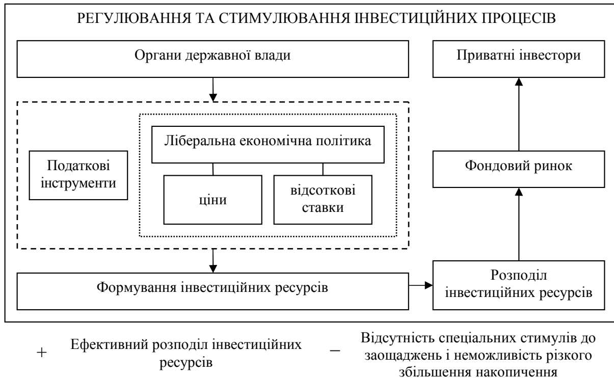
Рис. 1. Американська модель інвестиційної політики держави