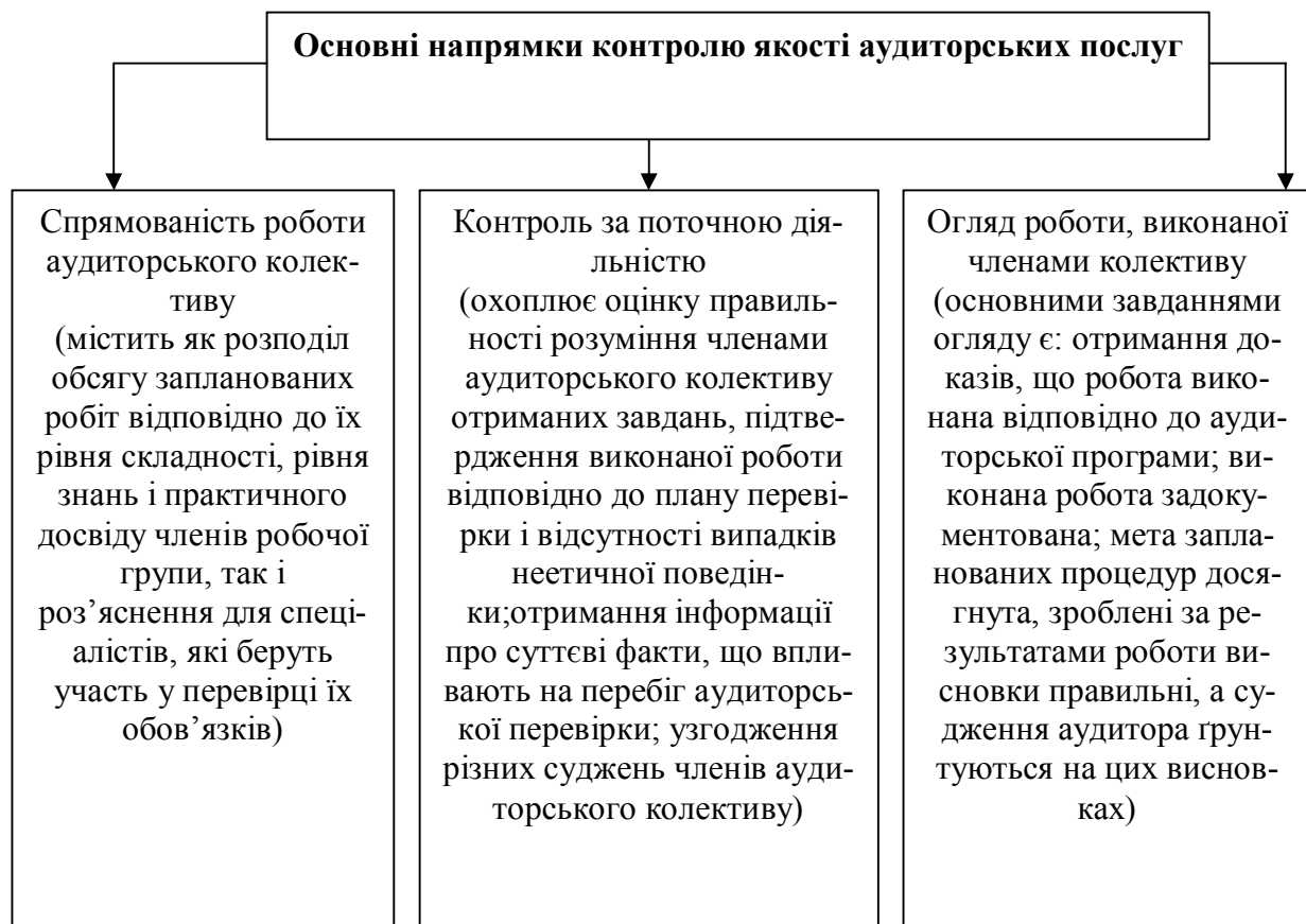
Рис.2 Основні напрямки контролю якості аудиторських послуг

На рис.2 нами узагальнені основні напрямки контролю якості аудиторської перевірки.