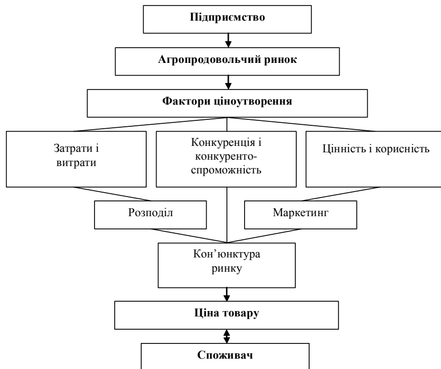
Рис. 1. Фактори ціноутворення на агропродовольчу продукцію в умовах ринку

Ціна безпосередньо залежить від виваженості системи економічних відносин, є засобом взаємозв'язку між продавцем і покупцем. В економічній теорії функціонування ринку у взаємозв'язку з діяльністю підприємства виокремлюють фактори ціноутворення (рис. 1).