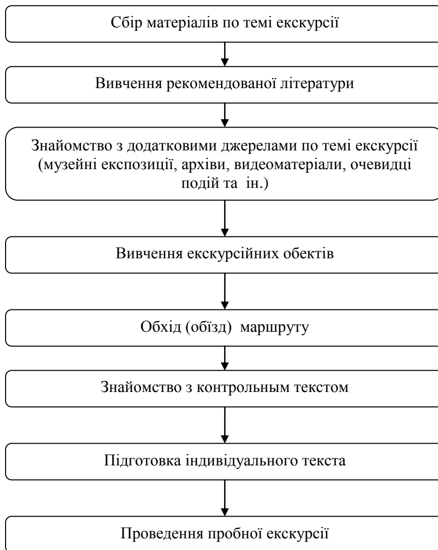
Рис. 8.1. Методика підготовки екскурсовода до нової екскурсії

Обов'язки екскурсовода, водія та порядок їх взаємодії представлені в матеріалах дидактичного забезпечення і регламентуються Правилами туристсько-екскурсійного обслуговування на автобусних маршрутах і турах.