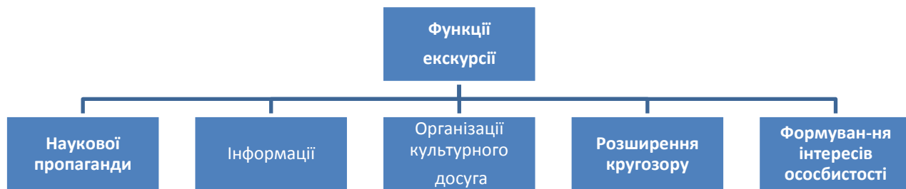
Рис. 2.2. Функції екскурсії.