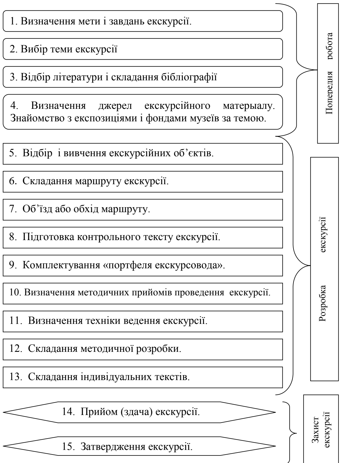
Рис. 3. Етапи створення екскурсії