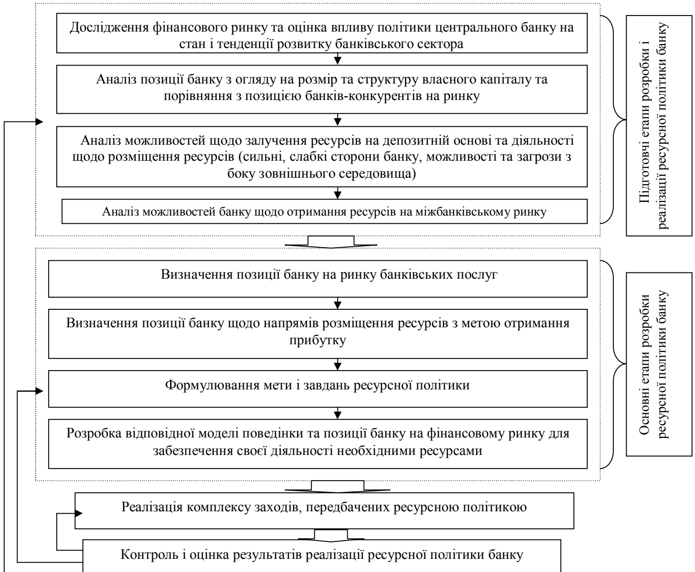
Рис. 2. Схема розробки і реалізації ресурсної політики банку

ресурсної бази та загального обсягу ресурсів, а також необхідності мобілізації коштів на міжбанківському ринку та адекватній оцінці ризику за кожною пасивною операцією; поліпшення якості сформованого депозитного портфеля у відповідності до строків і обсягів залучених ресурсів; врахування інтересів і потреб клієнтів банку щодо розміщених ними коштів та адекватне реагування на зміни кон'юнктури фінансового ринку.