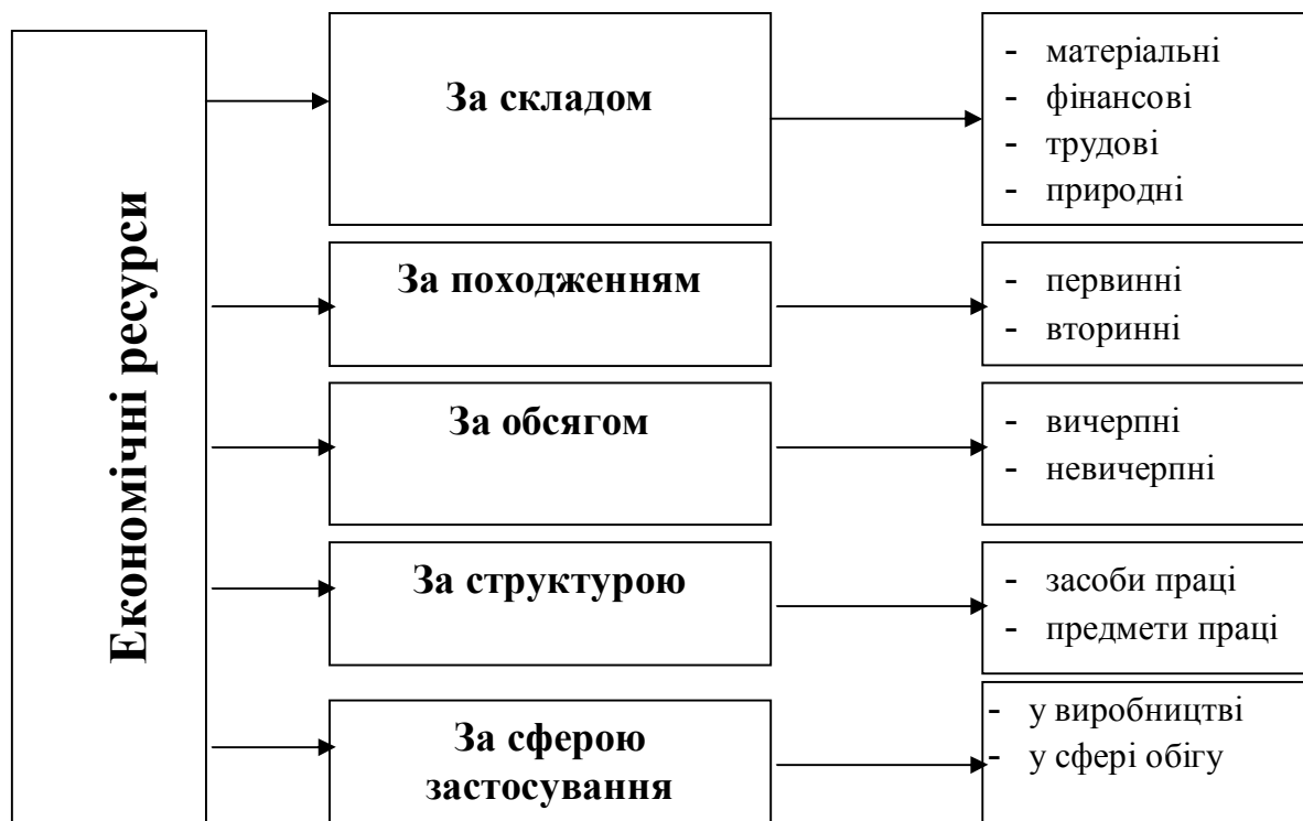
Рис.1. Класифікація економічних ресурсів

вони дещо відрізняються один від одного за складовими елементами. Термінологічний різнобій веде до підміни і нечіткості визначення поняття «матеріальні ресурси», що пояснюється відсутністю в економічній літературі об'єктивної характеристики останніх (табл. 1.).