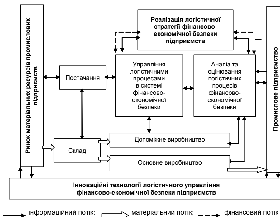
Рис. 2. Модель формування логістичної стратегії, спрямованої на забезпечення фінансово-економічної безпеки промислових підприємств

Відповідно, модель логістичної стратегії, спрямованої на підвищення рівня фінансово-економічної безпеки підприємства, може мати такий вигляд (рис. 2).