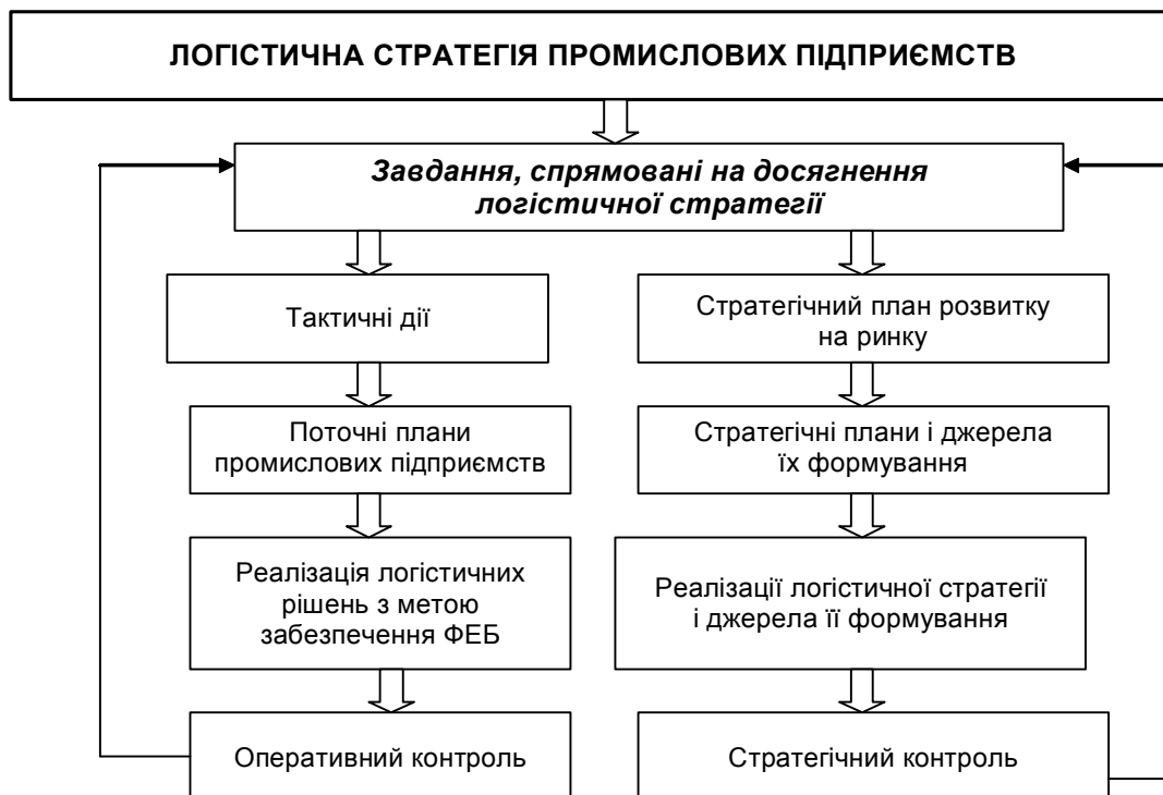
Рис. 1. Схема обґрунтування логістичної стратегії промислових підприємств

Можна дати таке визначення логістичної стратегії у системі забезпечення фінансово-економічної безпеки підприємства: це довгостроковий, якісно визначений напрямок розвитку логістики, що стосується форм і засобів її реалізації у фірмі, міжфункціональній і міжорганізаційній координації й інтеграції, сформульоване вищим менеджментом компанії відповідно до корпоративних цілей та з метою підвищення рівня фінансово-економічної безпеки підприємства (рис. 1).