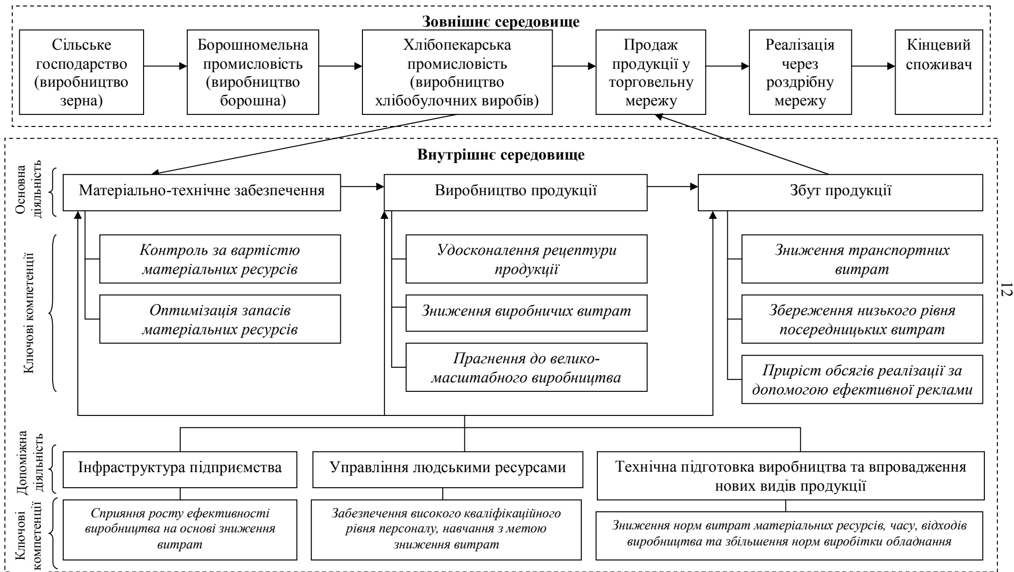
Рис. 2. Ключові компетенції у вартісному ланцюзі хлібопекарського підприємства при формуванні стратегії зниження витрат