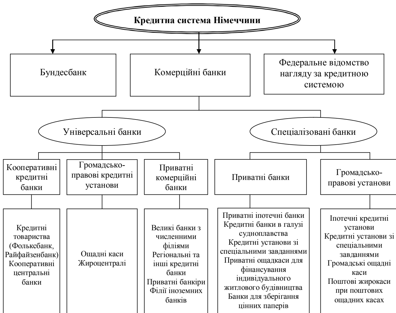
Рис.Е.1. Кредитна система Німеччини