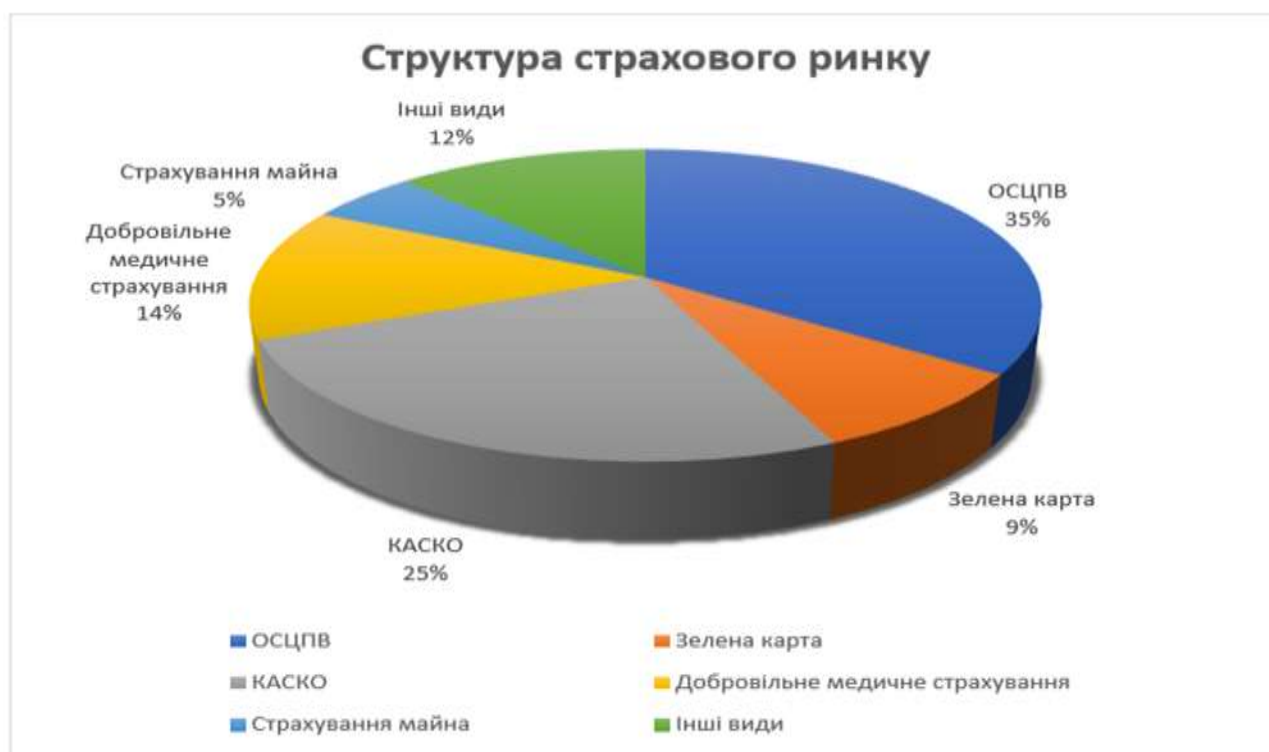
Рис. 2.1 Структура страхового ринку України у 2025 році [9]

Дослідження структури ринку страхування України в аспекті медичного страхування має важливе значення для оцінки його можливостей у залученні додаткових фінансових ресурсів до системи охорони здоров'я. Це дає змогу визначити ефективність функціонування добровільного медичного страхування та окреслити перспективи запровадження обов'язкового. Нинішня страхова система здатна сприяти впровадженню змін у системі охорони здоров'я та покращенню рівня та доступності медичних послуг, з урахуванням фінансових можливостей населення та потенціалу страхових компаній. На рисунку 2.1 можна побачити структуру страхового ринку України в 2025 році на початку 4 кварталу .