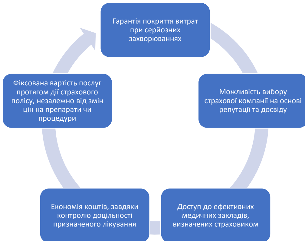
Рис. 1.3. Основні переваги добровільного медичного страхування [13]

Серед ключових переваг добровільного медичного страхування є переваги, які зображено на рисунку 1.3: