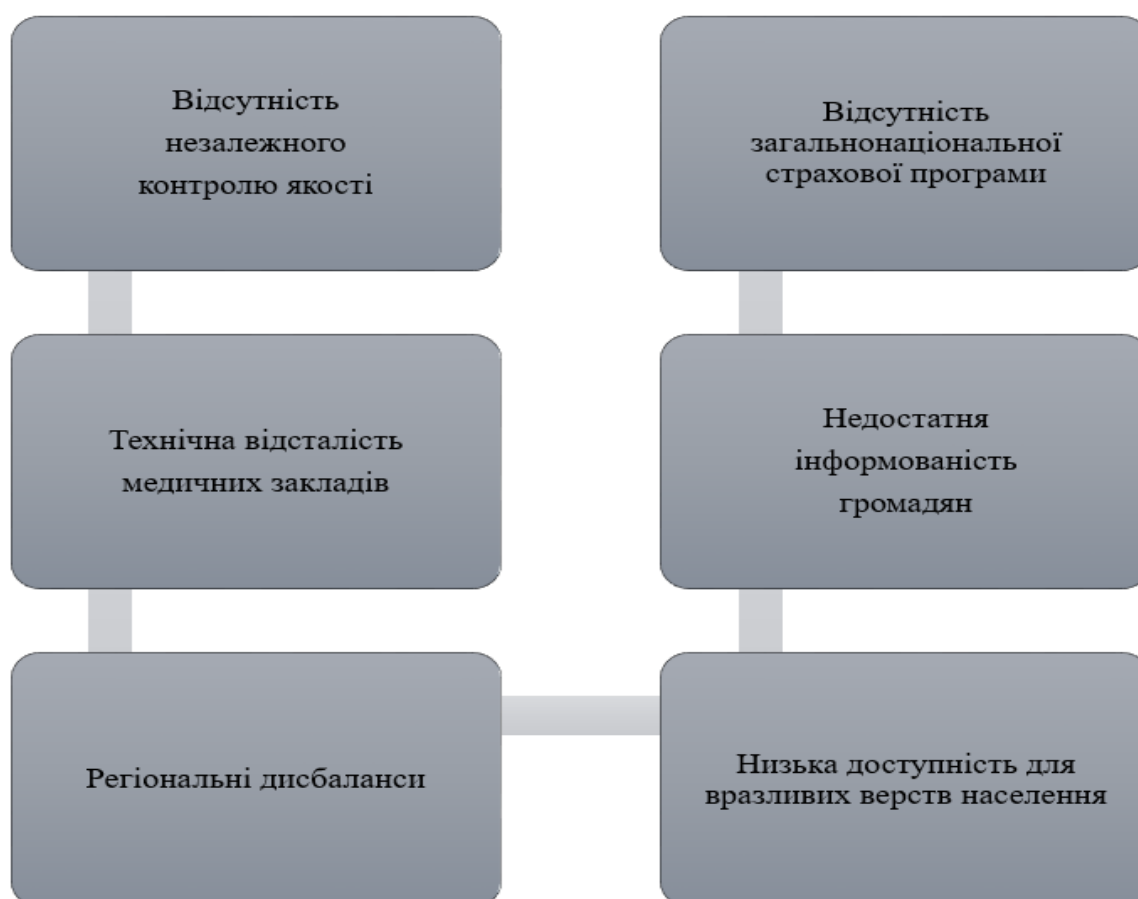
Рис. 3.1. Суттєві проблеми, які постають перед медичним страхуванням в Україні [38]

Загалом найбільш суттєві проблеми, з якими стикається українське медичне страхування можна зобразити на рисунку 3.1