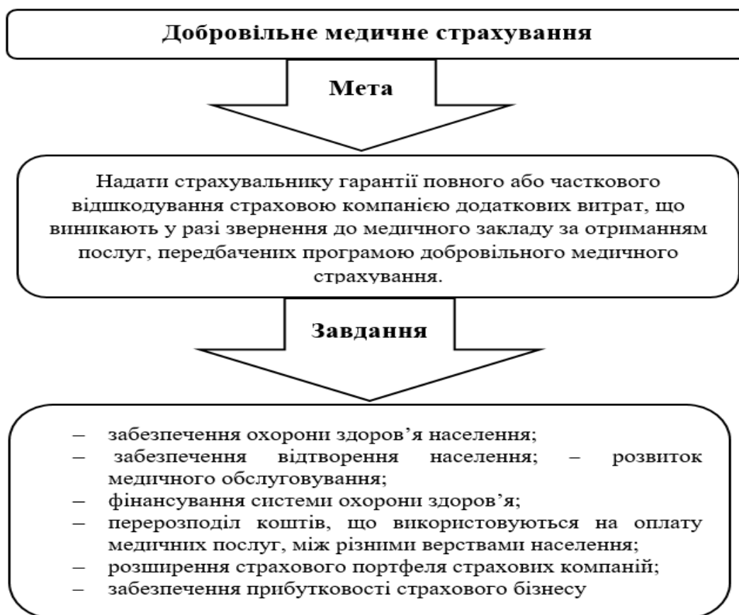
Рис. 1.1. Мета та завдання добровільного медичного страхування [7,8]