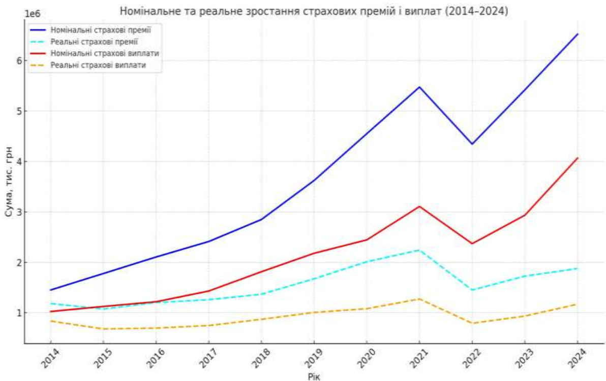
Рис. 2.3 Динаміка номінальних та реальних страхових премій та виплат на ринку ДМС у 2014–2024 рр., млрд грн [16; 17]

Попри війну та економічну нестабільність, ринок ДМС зберігає позитивну тенденцію розвитку. Зростання страхових премій випереджає збільшення виплат, що може свідчити про підвищення прибутковості сектору або зміну структури страхових продуктів. Водночас інфляційний тиск у 2022–2024 роках, спричинений воєнними подіями, суттєво знизив реальну купівельну спроможність страхових послуг. Отже, ринок добровільного медичного страхування демонструє помірне, але стабільне реальне зростання навіть у кризових умовах. Ігнорування інфляційного чинника, натомість, призводить до завищених оцінок масштабів і темпів розвитку галузі, тому врахування реальних показників є необхідним для точного стратегічного та регуляторного планування [16].