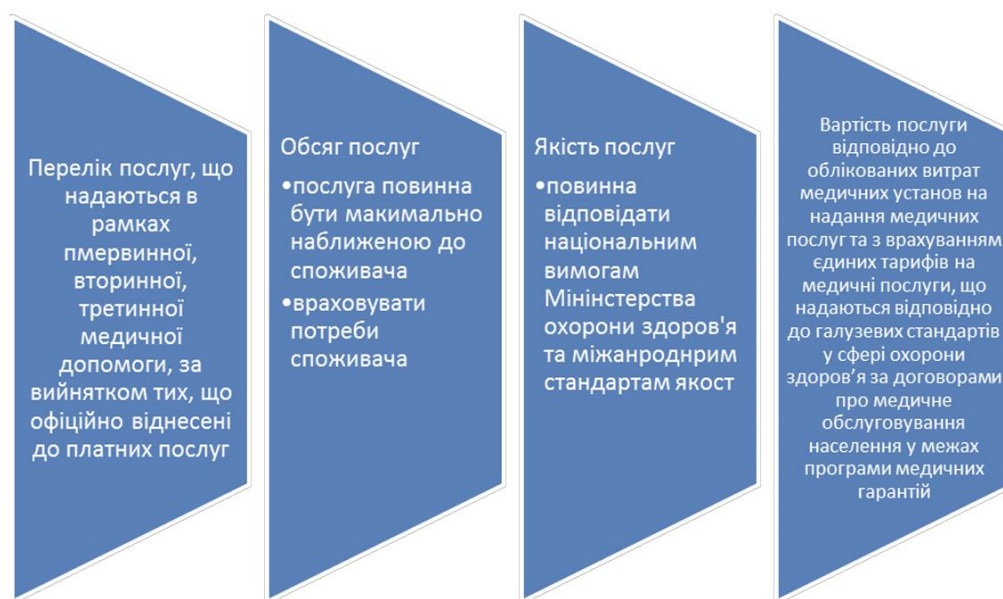
Рис. 1.2 Основні аспекти організації та забезпечення якості медичних послуг

охорони здоров'я, підвищення ефективності використання фінансових ресурсів і досягнення стратегічних цілей у галузі. Страхові організації укладають угоди з державними та приватними медичними закладами, гарантуючи оплату послуг і стабільність функціонування системи. Благодійні фонди співпрацюють із громадськими організаціями та місцевими громадами для ефективного розподілу коштів і підтримки соціально значущих проєктів. Інвестиційні фонди та банки тісно взаємодіють із приватними підприємцями, медичними асоціаціями та державними структурами, забезпечуючи фінансування нових проєктів і розвиток інфраструктури, що дозволяє не лише підтримувати поточні потреби медичної галузі, а й створювати умови для її довгострокового прогресу.