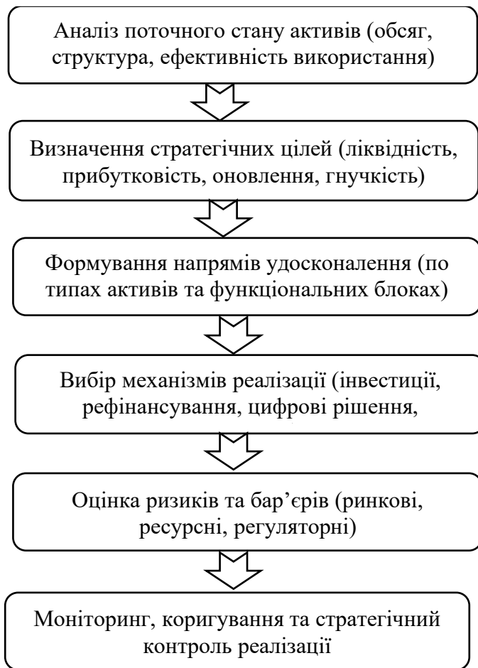
Рис. 3.1. Алгоритм формування інтегрованої стратегії управління активами підприємства

Розробка інтегрованої стратегії управління активами має відбуватись за чітким алгоритмом (рис. 3.1).