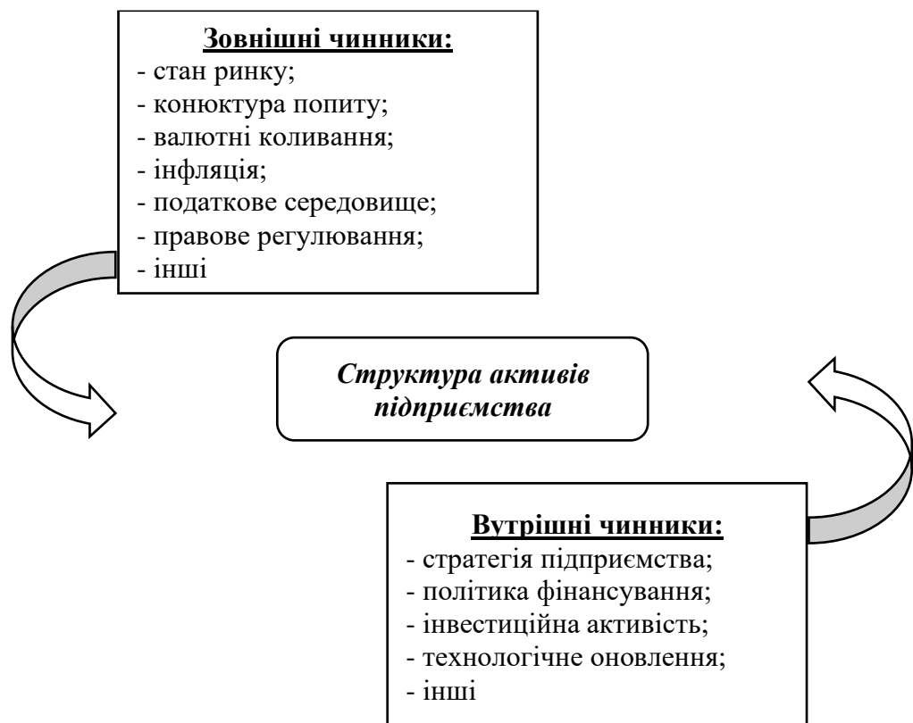
Рис. 1.1. Чинники, що впливають на структуру активів підприємства Сформовано за даними [14; 18]

Важливо наголосити, що структура активів підприємства є динамічною та схильною до постійних змін під впливом як внутрішніх управлінських рішень, так і зовнішніх економічних факторів (рис. 1.1). Внутрішніми чинниками, що зумовлюють трансформацію структури активів, виступають стратегія підприємства, політика фінансування, інвестиційна активність, рівень технологічного оновлення тощо. Зовнішніми ж є стан ринку, кон'юнктура попиту, валютні коливання, рівень інфляції, податкове середовище, правове регулювання та інші макроекономічні умови.