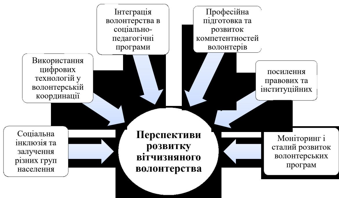
Рис. 3.2. Перспективи розвитку вітчизняного волонтерства

Прикладом виходу з цієї ситуації є досвід Департаменту освіти Львівської обласної військової адміністрації, який ініціював у 2023 р. розроблення Положення про волонтерську діяльність у закладах освіти області , в якому визначалась процедура залучення волонтерів до роботи з дітьми-ВПО. Зазначений документ став успішним прикладом формування регіональної нормативної-правової практики, якої бракує на державному рівні.