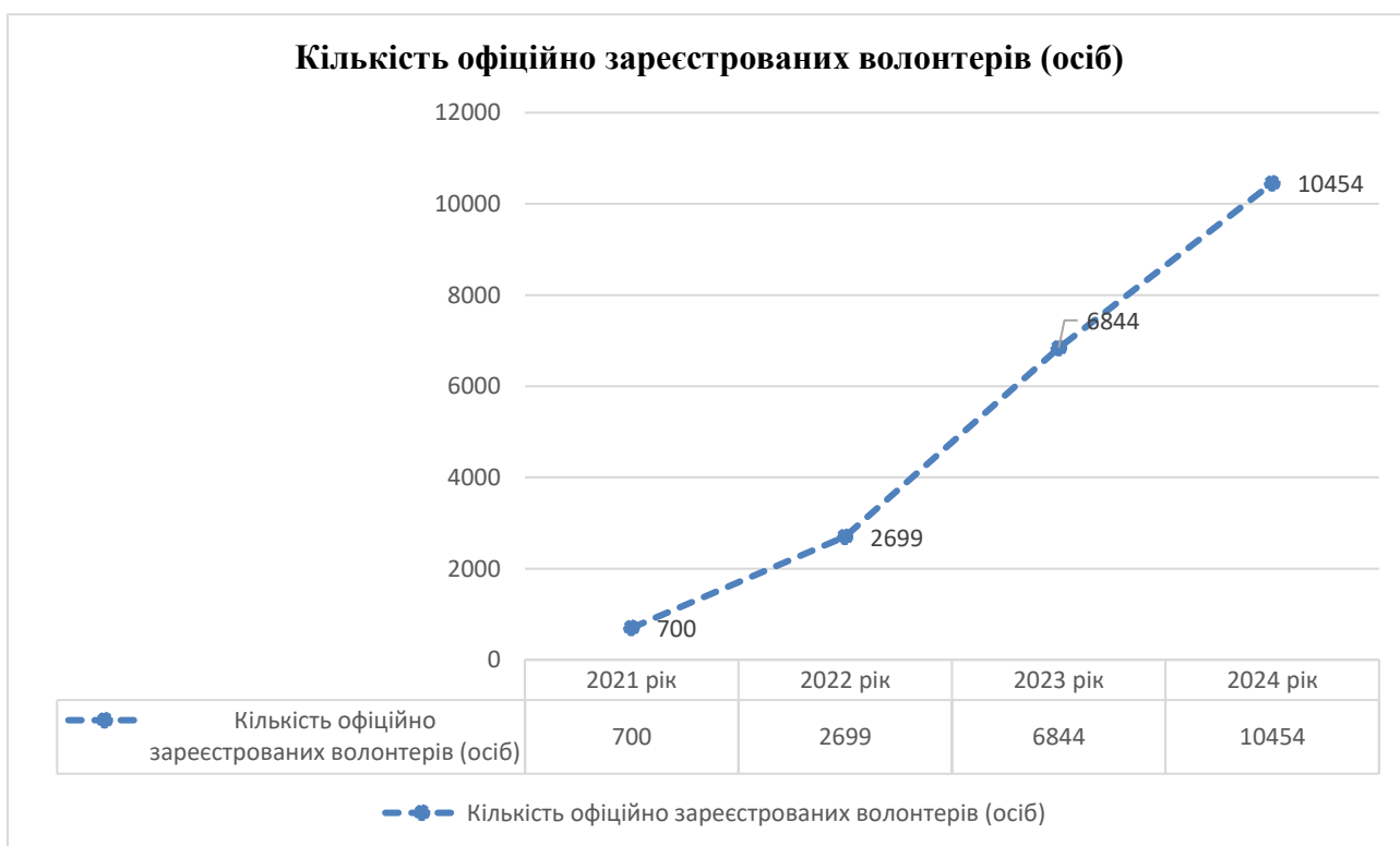
Рис. 2.1. Динаміка офіційно зареєстрованих волонтерів в Україні у 2021-2024 рр.