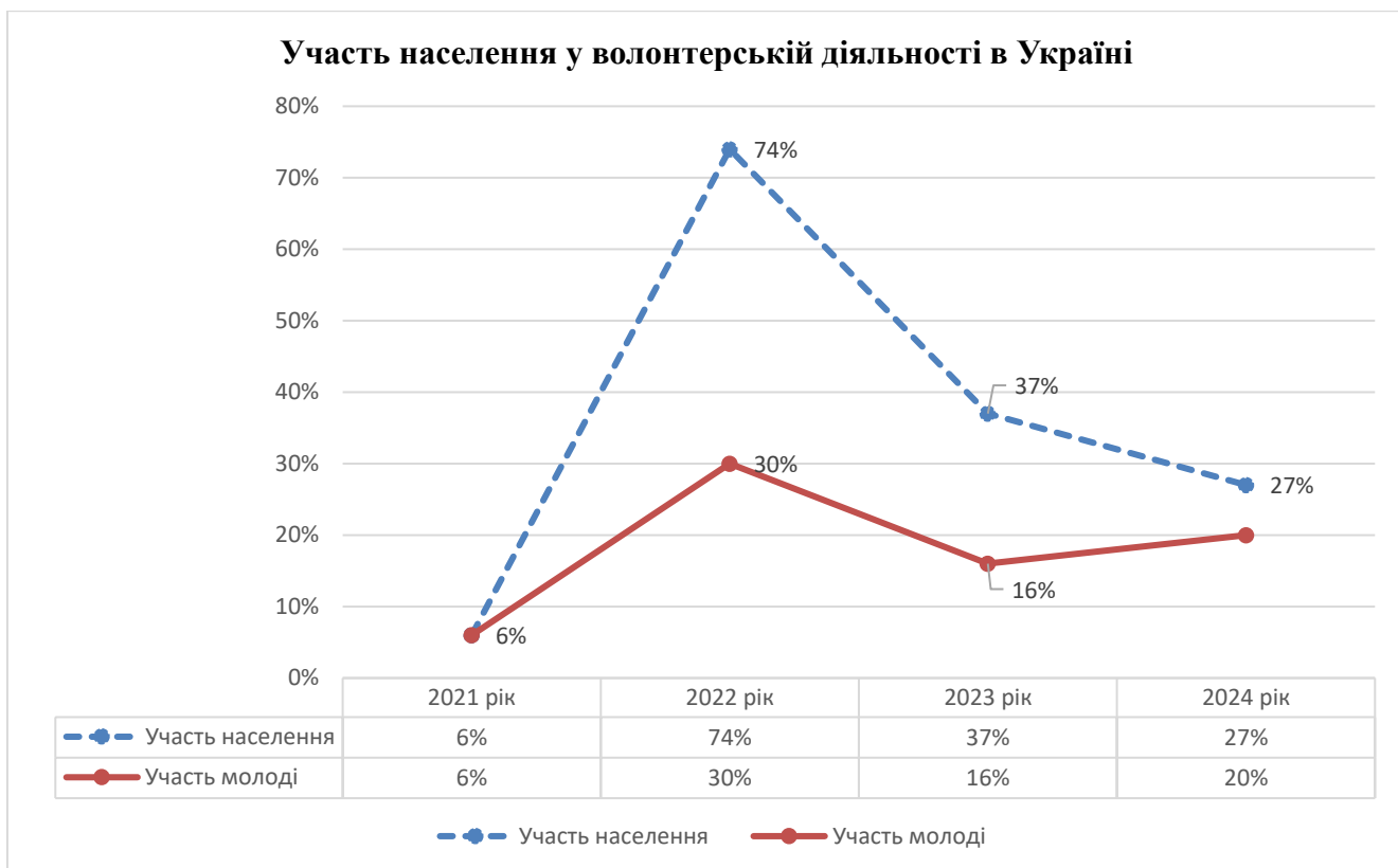
Рис. 2.1. Динаміка участі населення та молоді у волонтерській діяльності в Україні у 2021-2024 рр.