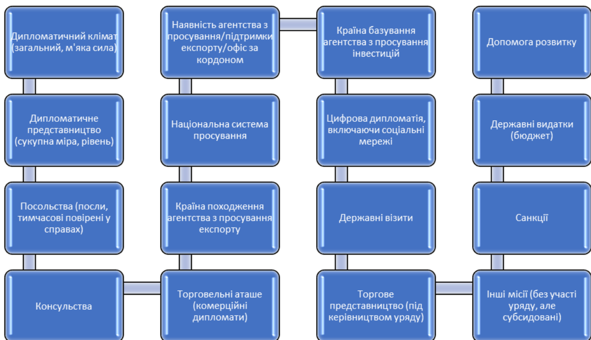
Рис. 1.1 Інструменти економічної дипломатії

що відображають різні рівні представництва. Важливим питанням було розрізнення впливу різних інструментів, наприклад, шляхом розмежування між економічним дипломатичним представництвом, з одного боку, та агентствами сприяння експорту, з іншого боку; або між посольствами і торговими місіями. Це дозволило зрозуміти, чи ці інструменти є доповненнями чи заміниками, тобто відбувається синергія чи витіснення. Інструменти економічної дипломатії визначають вузький периметр, який виключає діяльність відповідального міністерства та виключає посольства, консульства та внутрішню діяльність відповідального міністерства (дипломатичну мережу). Тобто вони охоплюють лише комерційну дипломатичну діяльність, і широкий периметр, який включає всю діяльність вдома та за кордоном, пов'язану із функцією економічної дипломатії (включаючи інновації) (див. рис. 1.1).