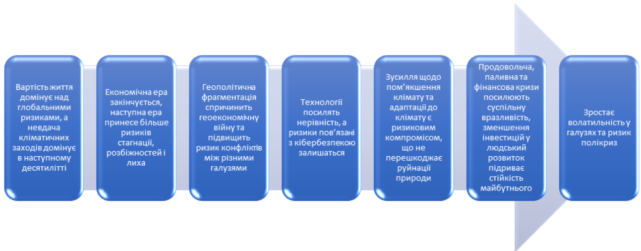
Рис. 2.2. Глобальні ризики в системі міжнародних відносин

енергетичні системи та менш стабільне геополітичне середовище. У результаті нова економічна ера може стати епохою зростання розбіжностей між багатими та бідними країнами та першим відкатом людського розвитку за десятиліття.