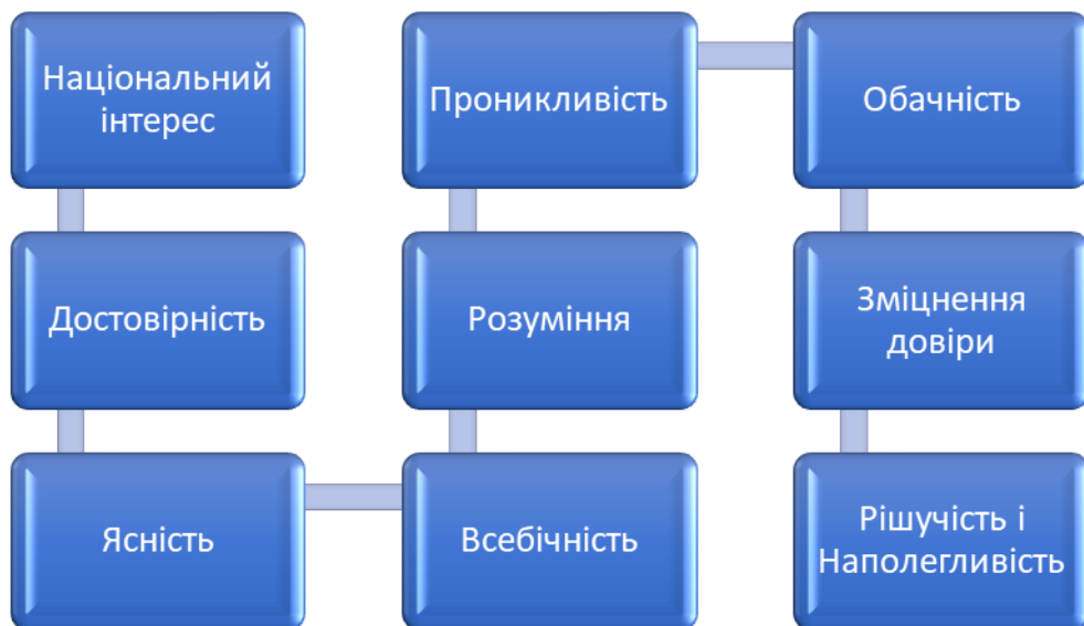
Рис. 3.1. Принципи розвитку економічної дипломатії

дипломатичні ситуації. Принципи також мають бути адаптованими до різноманітних дипломатичних ситуацій, але не повинні вважатися однозначно гнучкими, інакше вони не сприятимуть системному підходу, який відрізняє дипломатію від інших дисциплін, хоча їх можна застосовувати в різних обставинах. Принципи також повинні бути взаємодоповнювальними, а також внутрішньо суперечливими та не перешкоджати дипломатичному процесу. Зрештою, принципи мають бути практичними та актуальними в різноманітній дипломатичній діяльності серед зростаючої складності та міждисциплінарного характеру викликів зовнішньої політики та засобів реалізації. Пропонуємо звернути увагу на такі десять принципів дипломатичних операцій: