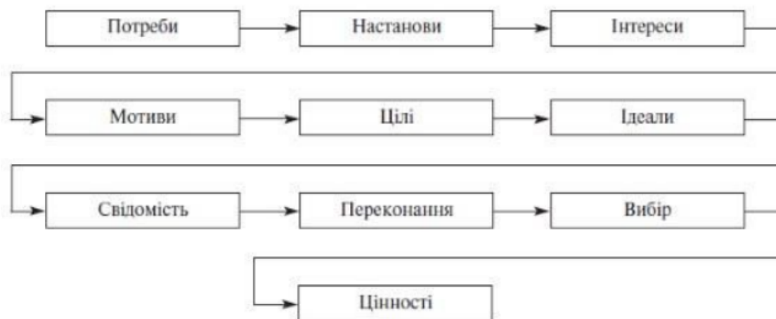
Рис. 1. Психологічна структура ціннісних орієнтацій.