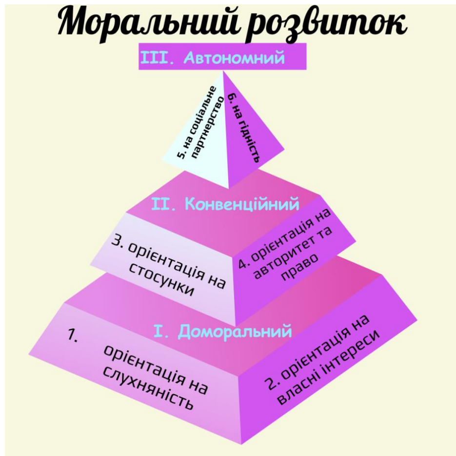
Рис. 2.1. Стадії морального розвитку за Л. Кольбергом

можуть бути характерними для осіб пубертатного періоду, що тісно пов'язані із суспільної етикою.