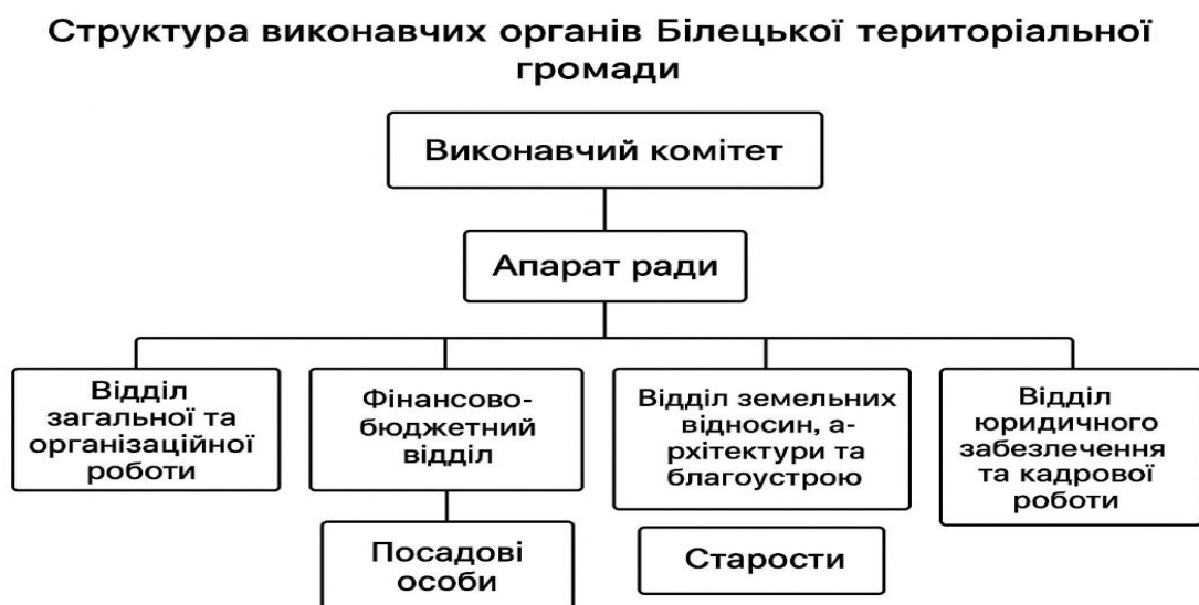
Рис. 2.1. Структура виконавчих органів Білецької територіальної громади

– відділ освіти, культури, туризму та охорони культурної спадщини, який реалізує політику громади у гуманітарній сфері, координує діяльність освітніх та культурних закладів.