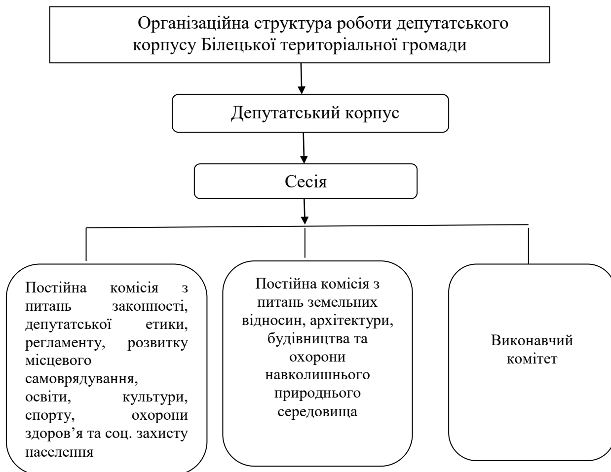
Рис. 2.2. Організаційна структура роботи депутатського корпусу Білецької територіальної громади

Примітка. Складено автором на основі [22]