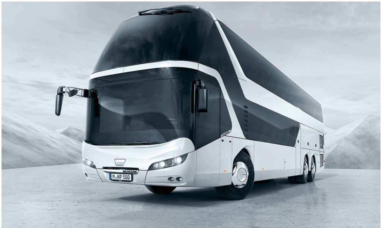
Рисунок 2.3 – Зовнішній вигляд Neoplan Skyliner 2019

Усі ці заходи спрямовані на те, щоб підвищити комфорт і якість обслуговування пасажирів, скоротити час поїздки, зробити маршрут більш конкурентоспроможним на ринку і тим самим залучити більше пасажирів, що позитивно позначиться на роботі підприємства.