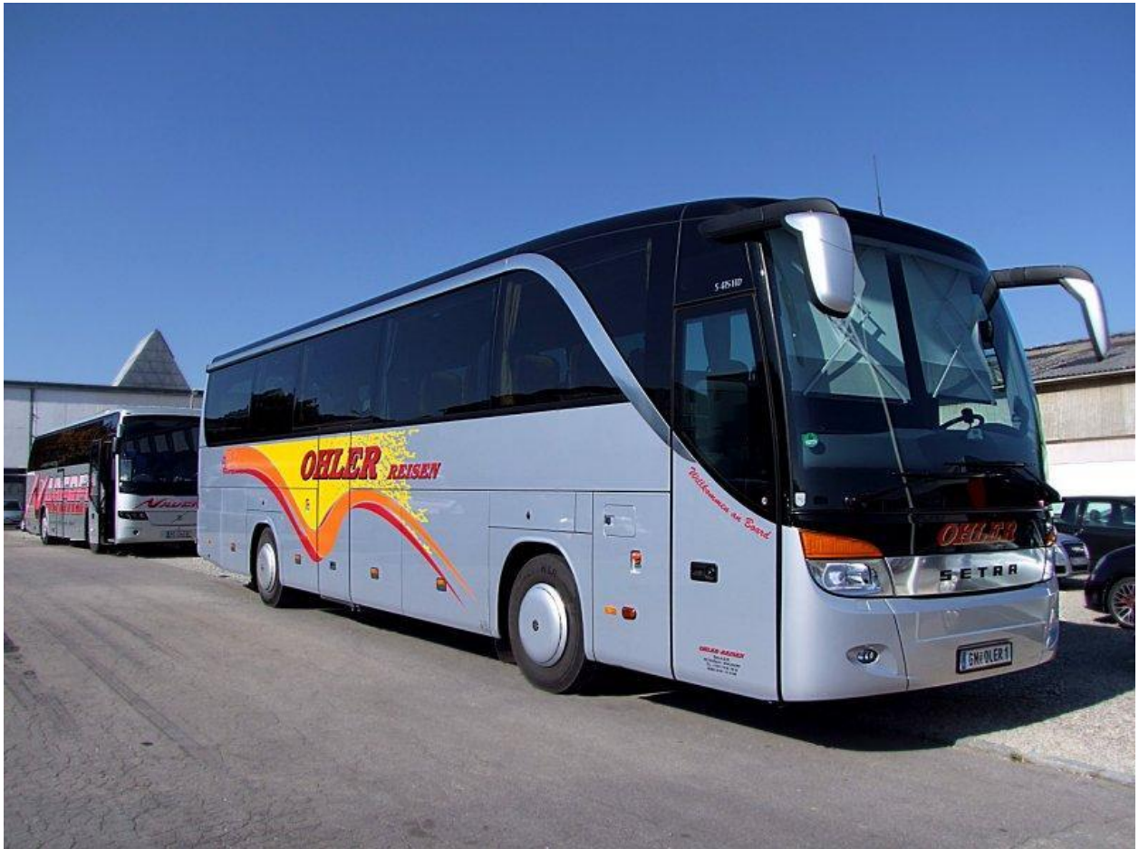
Рисунок 2.2 – Зовнішній вигляд SetraS415HD

запам'ятовується, що допоможе привернути увагу потенційних пасажирів і сформувати позитивний імідж маршруту.