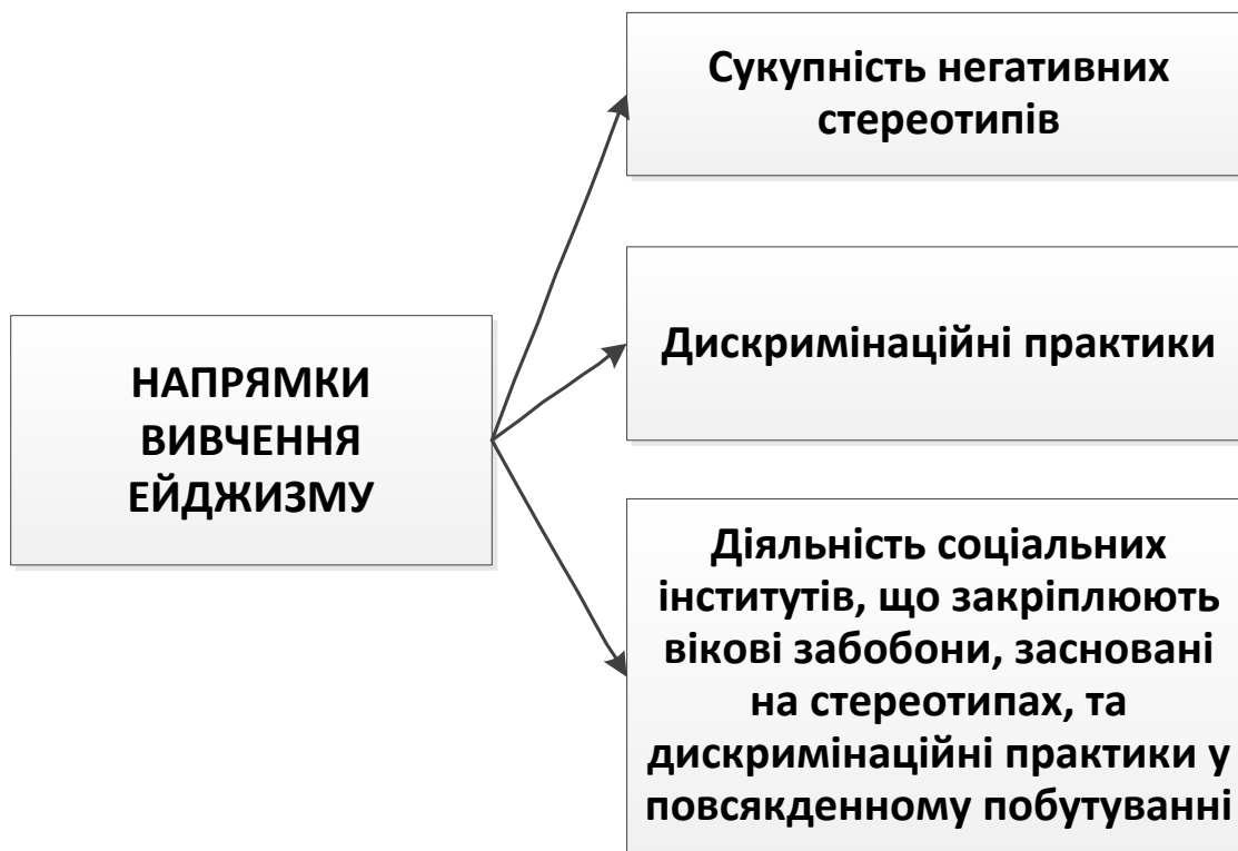
Рис. 1.1. Ключові напрямки вивчення ейджизму

Геронтологічний ейджизм, який ми розглядаємо як негативну вікову стереотипізацію, досліджується найбільше в рамках когнітивного та соціокультурного підходів. У рамках когнітивного підходу стереотипізація вивчається як механізм сприйняття, що забезпечує швидку оцінку ситуації, особливо в умовах дефіциту інформації. Соціокультурний підхід стереотипізацію розглядає як механізм соціальної ідентифікації, і в результаті – соціальної адаптації [12; 28; 31]. Аналогічне визначення зустрічається в публікаціях А. Тракслера [35], який розглядає ейджизм як будь-яку установку, поведінку чи соціальний інститут, які субординують людей за ознакою віку, а також як процес приписування людині тих чи інших соціальних ролей на основі її віку [4]. У роботі А. Кадді [20] ейджизмом позначаються стереотипи та забобони щодо представників певної вікової групи, що призводять до її дискримінації.