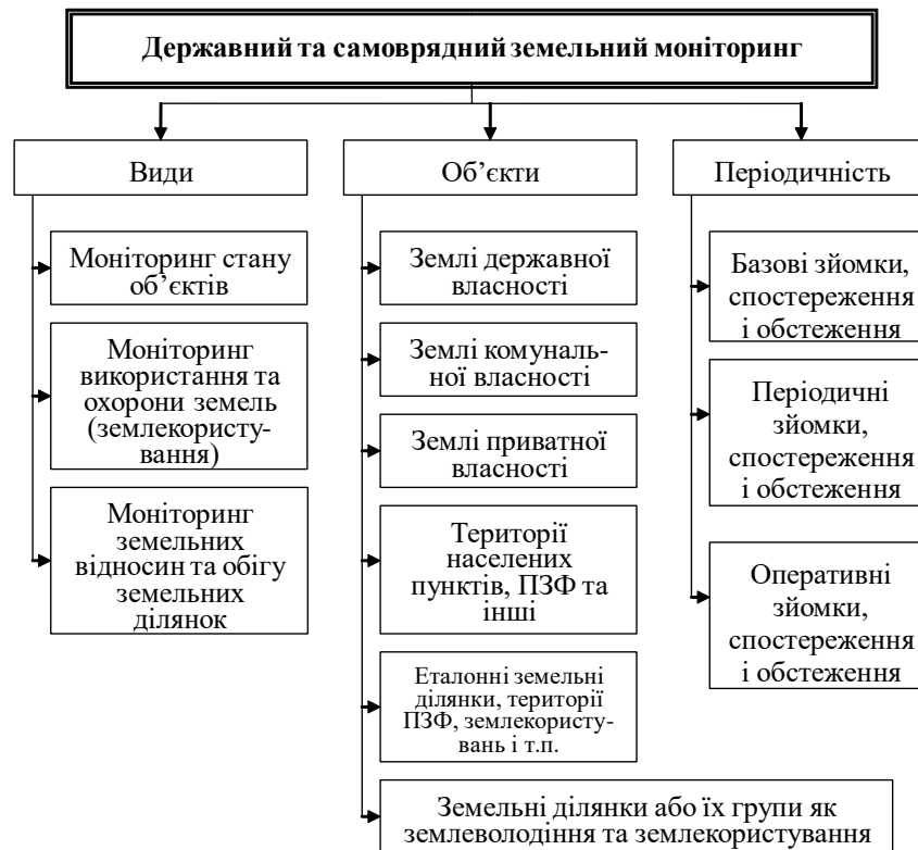
Рис. 1.2. Види, об'єкти та періодичність державного та самоврядного земельного моніторингу [41, с. 8]

Земельний моніторинг передбачає спостереження за станом і використанням земель, зокрема землекористуванням, яке пов'язане з життєдіяльністю людей, а також змінами форм та режиму землекористування. Цей моніторинг формує інформаційну базу для проведення державного земельного нагляду, забезпечуючи органи влади, організації та громадян інформацією про використання земель. За допомогою сучасних технологій, таких як геофізична та інша інформація, можна передбачати сприятливі та несприятливі фактори для господарювання та вживати заходів для зменшення впливу несприятливих умов на життя та діяльність людей. У сучасних умовах прийняття рішень, пов'язаних з реалізацією дій на землі, передбачає аналіз широкого спектру достовірних та регулярно оновлюваних даних про стан об'єктів моніторингу.