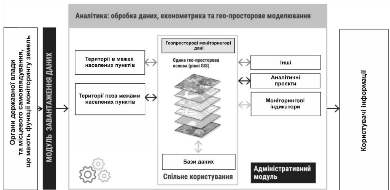
Рис. 1.5. Схематичне відображення інформаційного забезпечення моніторингу земель прикордонних територій [2, с. 10]

Додатково, важливо охопити всі категорії земель, створити базу даних та геоінформаційну систему, удосконалити науковий супровід та встановити нові типи зав'язків між замовниками та виробниками інформації (рис. 1.5).