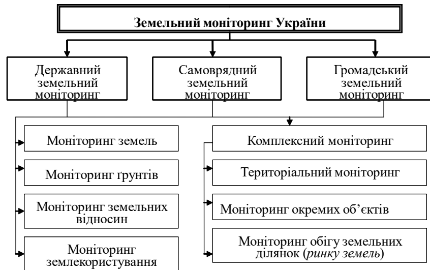
Рис. 1.1. Система земельного моніторингу в Україні [41, с. 7]

стану земель, земельних ресурсів, земельних відносин, землекористування та ринкового обігу земельних ділянок.