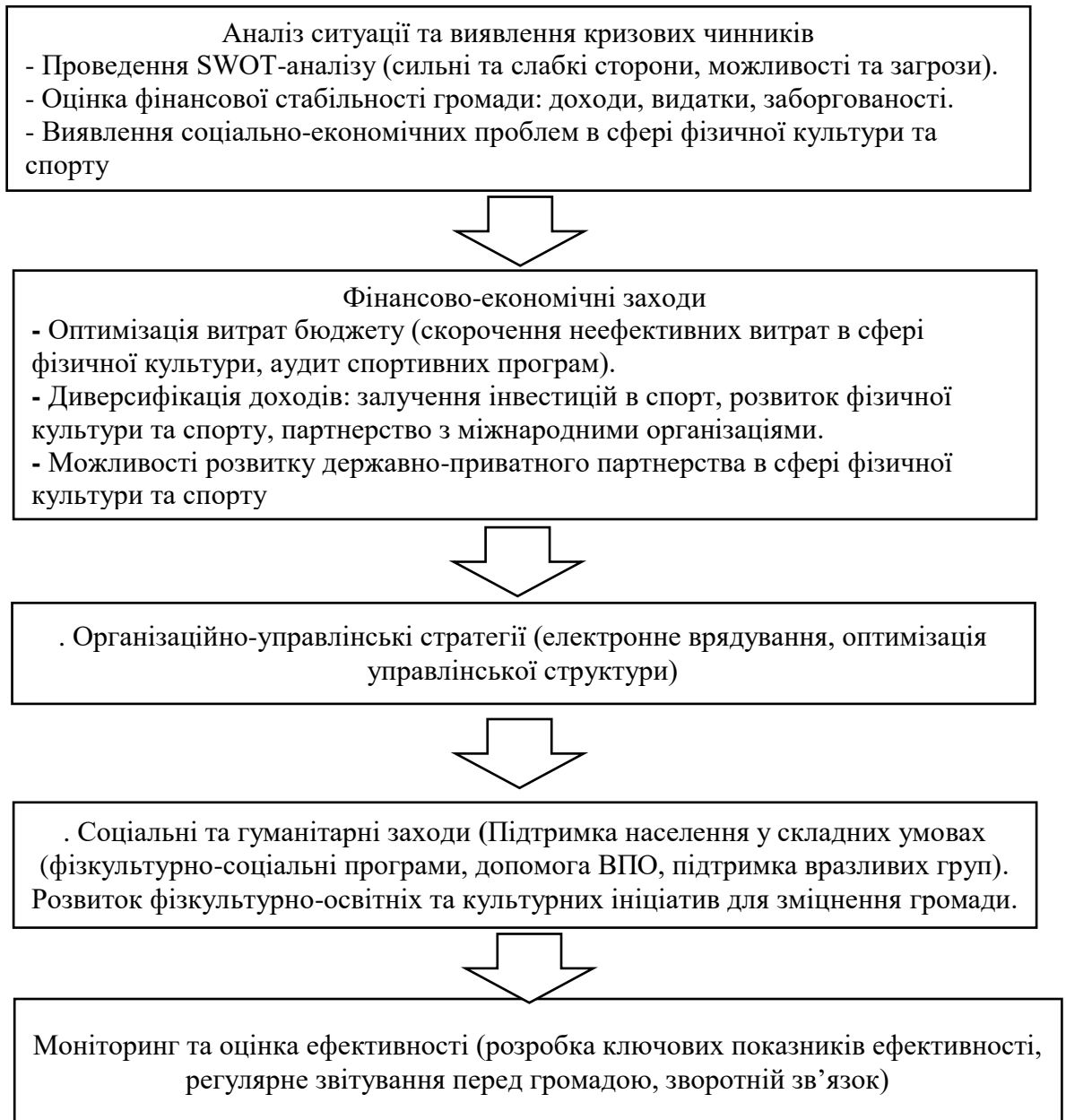
Мал 3.1 Блок-схема підвищення ефективності управління фізичною культурою та спортом у Немирівській міській раді

Стратегії управління фізичною культурою та спортом для Немировської міської ради повинна поєднувати фінансову стабілізацію, цифрову трансформацію управління, соціальну підтримку та розвиткові проекти, що дозволить підвищити стійкість громади