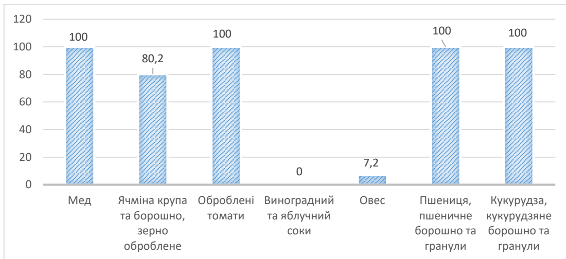
Рис. 2.3. Рівень використання тимчасових тарифних квот АТП Україною у 2019 році, %.

грн. домогосподарствам за утримання однієї голови молодняка великої рогатої худоби до 13-місячного віку» [19]. Також необхідно зазначити, що «завдяки урядовій програмі державної підтримки аграріїв у 2018 р. уряд здійснює компенсацію у розмірі 25% (замість 20% у 2017 р.) вартості придбаної сільгосптехніки, 70% вартості обладнання, придбаного у результаті створення кооперативу та 80% здійснених витрат з придбання матеріалу плодово-ягідних культур, винограду та хмелю» [19].