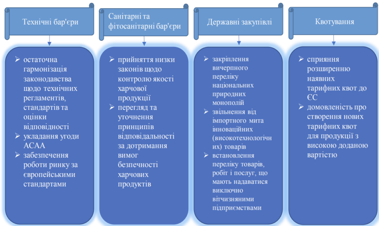
Рис. 3.1. Заходи з реформування системи нетарифного регулювання зовнішньої торгівлі України.

Відповідно до Угоди про асоціацію з ЄС, «тарифні квоти на ввезення сільськогосподарської продукції почали розширюватися не лише з боку країн Євросоюзу, а й із нашого. На даний момент для імпорту з ЄС діють п'ять тарифних квот: три основні та дві додаткові. Вони стосуються таких товарних груп, як м'ясо птиці, м'ясо свинини, цукор» [3].