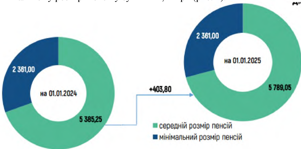
Рис. 2. Динаміка середнього і мінімального розмірів пенсій в Україні у 2024-2025 роках (станом на 1 січня кожного року) [2]

Характерною ознакою у сфері вітчизняного пенсійного забезпечення є хоча і незначне, проте, все ж таки, зростання середнього розміру пенсії в Україні (з 5385,25 грн у 2023 році до 5789,05 грн у 2024 році) при, водночас, незмінному мінімальному розмірі пенсії у сумі 2361,00 грн (рис. 2).