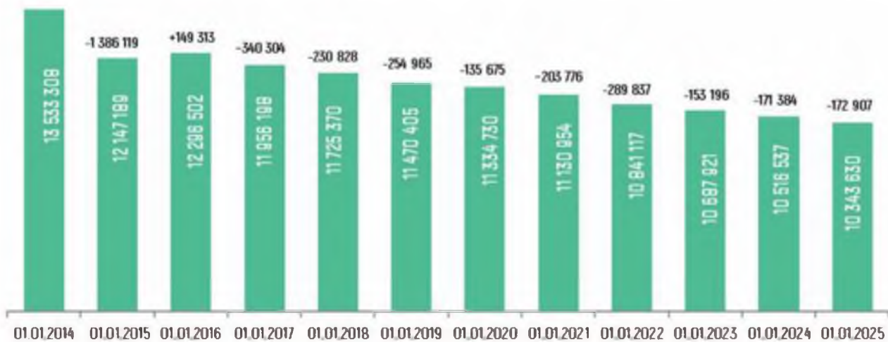
Рис. 1. Динаміка кількості пенсіонерів в Україні у 2014-2025 роках (станом на 1 січня кожного року) [2]

договорами здійснено виплату пенсій на суму 0,4 тис. дол. США та 5 617,3 тис. євро» [1].