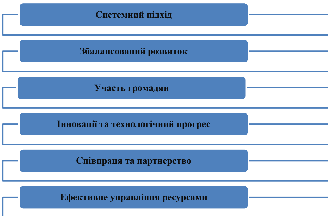
Рис. 2. Основні етапи розробки стратегії розвитку територіальної громади

Формування стратегії розвитку територіальних громад в Україні базується на теоретичних засадах, які охоплюють різні аспекти економіки, соціології, політики та інших наук. Найважливіші з них відображені на рисунку 2.